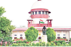
कि याचिकाकर्ता ने प्राथमिक रूप से एकआडोईआर को रद्द करने की मांग की थी और एक विकल्प के रूप में उसने जांच के उद्देश्य

में उनके खिलाफ दर्ज अलग-अलग केस दिल्ली में कलब किए जाएंगे। नूपुर के खिलाफ सबसे पहले महाराष्ट्र में मामला दर्ज किया गया था। उसके बाद पश्चिम बंगाल, राजस्थान में अलग-अलग मामला दर्ज किए गए हैं। सुप्रीम कोर्ट ने सुनवाई में कहा कि यह अदालत पहले ही याचिकाकर्ता के जीवन और सुरक्षा के लिए गंभीर खतरों का सज्ञान ले चुकी है, हम निर्देश देते हैं कि नूपुर के खिलाफ सभी एकआडोईआर को ट्रांसफर कर दिल्ली पुलिस को जांच के लिए जोड़ा जाए। सुप्रीम कोर्ट ने कहा