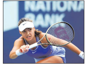
पृष्ठ 8 ■ मूल्य : 2 रु.