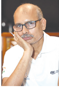
द्वारा प्रतिस्थापित किया गया, इसके बाद राष्ट्रीय राजधानी क्षेत्र दिल्ली अधिनियम, 1991 की सरकार द्वारा भारत के संविधान में 79 वें (अनहतरवां) अंश...