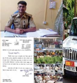
मुरैना शहर का अच्छा खास अनुभव है और उन्हें आगामी कार्यकाल में जरूर इसका अच्छा खासा फायदा मिलेगा...