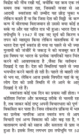
वर्षों तक निरंतर संघर्ष चला, इसके लिए हजारों लोगों ने अपने देश हित में अपना हस्तोद्वेग व्यक्त कर दिए और उन वीर शहीदों ने कभी शायद स्वप्न में विचार नहीं किया होगा कि जिस स्वतंत्रता के लिए अपने प्राण इस मिट्टी को दे दिए एक बार पुनः यह वसुधा गुलामी के दलदल में जकड़ ली जाएगी। अतः यह एक

विचारणीय विषय है, इतने लंबे समय में यहाँ पर किन्न-किन्न क्षेत्रों में विकास का चरोमोल्कप हुआ है। जैसा कि राजनीतिक, आर्थिक, सामाजिक, शिक्षा वाह अन्य क्षेत्रों विकास की स्वतंत्रता के लिए एक लंबा संघर्ष चला बना इन सभी क्षेत्रों में 75 सालों में भारत देश पूर्ण स्वतंत्र हो पाया है या उससे भी बुरी स्थिति से गुजर रहा है। क्योंकि उस समय बाहरी देशों के लोगों से भय था लेकिन आज जब सभी भारतीयों राष्ट्र का चौरवा स्वतंत्रता दिवस मनाते जा रहे हैं, तब यह महसूस होता है कि आज अपने ही लोग इस राष्ट्र को दोहन कर रहे हैं क्योंकि उन देशों में लगे हुए हैं। इस प्रकार के दोहन लोगों को अभी है पता नहीं है कि 18 57 से 1947 तक 14000 लोगों की शहादत ही यह थी तब कहीं जाकर 1947 में स्वतंत्रता की नींव रखी गई और भारत देश में एक लंबे समय बाद अपने जीवन को नई शुरुआत की अतः जो देश की मिट्टी को रसातल करने में लगे हुए उनके लिए आज आम जनता को एक बार पुनः विचार करना चाहिए कि उनको शहादत व्यर्थ न जाए और 175 में ईस्ट इंडिया कंपनी की स्थापना के बाद इन्होंने भारत के लोग दोहन करने में अपना व्यापार फैलाते की दमनकारी नीति की शुरुआत कर दी। अतः भारत में वास्तविक रूप से देखा जाए तो स्वतंत्रता दिवस की शुरुआत यहाँ से प्रारंभ हो गई। लेकिन उर आंदोलन 18 57 से 1947 के बीच हुए। जिन्होंने