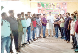
पत्रकारों की समस्त विधानसभा तक ले जाने का जनप्रतिनिधियों ने दिया आक्षेप