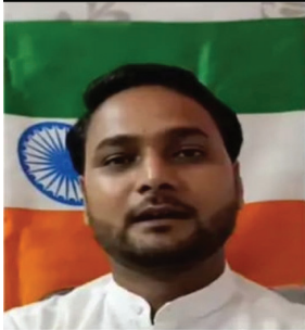
सख्त कदम उठाए। ताकि 15 अगस्त के बाद राष्ट्रीय ध्वज के अपमान के मामले दिखाई न दें।

टीकमगढ़। जतायें दुकान हटाने के चक्र में व्यापारी ने जमीन पर गिराया तिरंगा टीकमगढ़ में जटा तिरंगा लगाकर भाजूपी कार्यकर्ता ने की अपील। जिले में वीते 24 घंटे के दौरान राष्ट्रीय ध्वज के अपमान के 2 मामले सामने आए हैं। पहला मामला नगर परियोजना का है। जहाँ एक दुकानदार ने घड़ौसी की दुकान को गिरा दिया। इसी दौरान दुकान पर लगा राष्ट्रीय ध्वज भी जमीन पर गिर गया लेकिन दुकानदार ने तिरंगे झंडे के अपमान का कोई ध्यान नहीं रखा। इस घटना का वीडियो जमकर वायरल हो रहा है। वहीं दूसरी घटना टीकमगढ़ में सामने आई है।