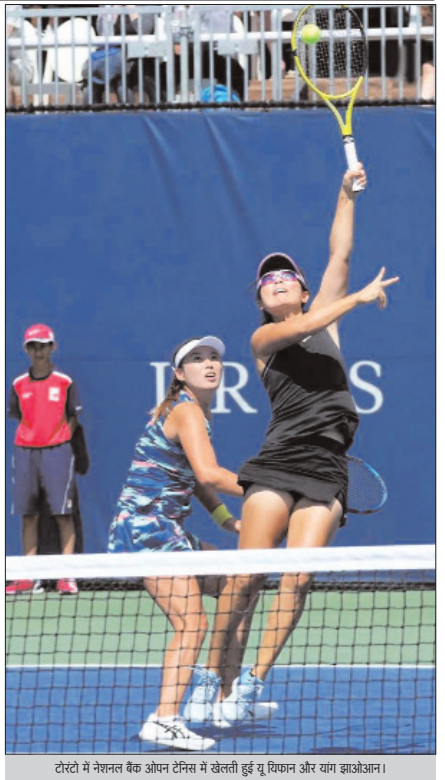
टोरेतो में नेशनल बैंक ओपन टैनिंस में खेलती हुई युवा फायन और वाम झाओआन।

एकदिवसीय सीरीज के लिए भारत और जिम्बाब्वे ने घोषित की टीमें हरारे । भारत और जिम्बाब्वे क्रिकेट ने 18 अगस्त से शुरू हो रहे एकदिवसीय क्रिकेट सीरीज के लिए आठ-आठवीं टीमों की घोषित की है।