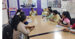
गतिविधियों से अन्ततः करते हुए युवा अधिकारों पर भी चर्चा की एवं उन्होंने सभी को आगे बढ़ने की राह दिखाई दे रखा है। प्रत्येक राष्ट्र की अपनी अपनी अलग विचारधारा होती है। इसी विचारधारा को अपना देह मान के प्रत्येक मनुष्य एक निजी वाह राष्ट्र की स्वतंत्रता को सुनिश्चित करता है। यद्यपि निर्मित होने के पश्चात विकास का क्रम धीरे धीरे मानव जीवन में चलने लगा, इसी समय कुछ लोगों ने अपनी स्वयं की महत्वाकांक्षाओं के लिए और गुलामी की नीति का अनुसरण करते हुए बहुत से राष्ट्रीय को अपने चंगुल में ले लिया। जिससे मानव जीवन कड़ी की शुरुआत से गई। इसी राष्ट्रीय में भारत देश भी था, जहां पर शुरुआती दौर में मुस्लिमन, पुर्तगाल, डच और अंग्रेजों ने दमन व गुलामी की प्रक्रिया को एक लंबे समय तक कायम रखा। जिससे भारत देश धीरे धीरे खोखला होने लगा, जोकि विश्व पटल पर सभी क्षेत्रों में एक अलग ही पहचान रखता था। लेकिन यहाँ की द्वेष भावना का फायदा इन दुष्ट प्रवृत्ति के लोगों ने उठवाया, जिससे नारिके को अपना जीवन जीना वा मुश्किल हो गया और यहाँ से एक विद्रोह की नींव रखी गई, क्योंकि यह क्रम एक लंबे समय तक चलता रहा, जिसकी वजह से आम आदमी स्वतंत्रता की उम्मीद यह छोड़ चुका था, लेकिन कहना है ना कि जिस देश की मिट्टी के भार में खोखला परिजानमान हो उसमें क्या कोई हरा सके गा और यह चरित्र रात्र भी हुआ। भारत देश की तपोभूमि ने 1947 में एक नए सूर्य की किरणों को तपन की महसूस किया लेकिन वास्तविक में क्या भारत देश पूर्ण स्वतंत्र हो गया या पहले से भी ज्यादा गुलामी की कजोरों में जकड़ने को मजबूर कर है? इस विषय पर भारत के प्रत्येक नागरिकों पहल चिंतन करने की आवश्यकता है, जैसा कि वर्तमान में दिखाई दे रहा है। देश की स्थितियाँ पहले से ज्यादा भयंकर बनने वाली हो रही हैं। पहले तो बागीरों को पर भय था, लेकिन आज इसके विपरीत यहाँ के कुछ लोग देश के उसी स्थिति में ले आने के आदुर दिखाई दे रहे हैं।