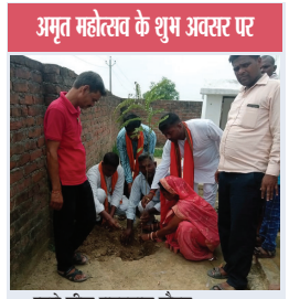
अमृत महोत्सव के शुभ अवसर पर जलापुर तहसील मालीपुर थाना अंतर्गत रकनपुर ग्राम सभा के प्रांशरी पाठशाला में अमृत महोत्सव के शुभ अवसर पर...