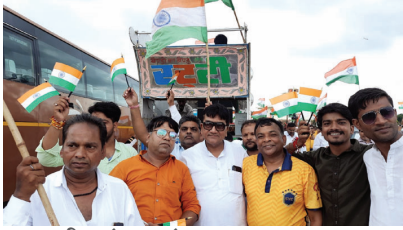
भगवान शांतिनाथ के दरबार में स्याद्वद्र युवा क्लब के दो सैकड़ लोगों द्वारा निकाली गई तिरंगा यात्रा

अंबवा। हर घर तिरंगा अभियान के तहत सोमवार को सुबह विश्व प्रसिद्ध जैन तीर्थ क्षेत्र सिंहाणिया जी में स्थित श्री दिगंबर जैन शांतिनाथ मंदिर में अलग ही नजारा देखने को मिला। यहां पर स्याद्वद्र युवा क्लब दिल्ली के लगभग दो सैकड़ सदस्यों ने आकर जन कल्याण की कामना के उद्देश्य से भगवान शांतिनाथ