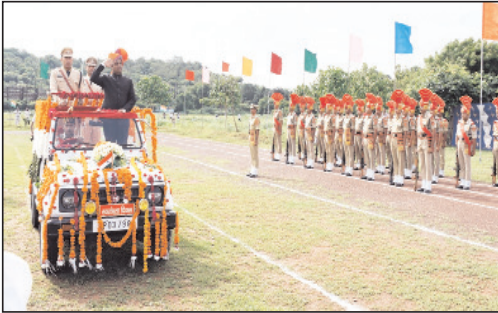
दूसरे एवं 13वीं बटालियन एसएफ के तृतीय स्थान की शौल्ड प्रदान की गईं। कार्यक्रम में इनके अलावा ईसीएस बैलेस स्कूल, शासकीय उच्च

उ.मा. विद्यालय क्र.-1 पुरार और सेंट्रल एकेडमी स्कूल के बच्चों द्वारा भी सांस्कृतिक कार्यक्रम प्रस्तुत किए गए। बड़ी संख्या में मौजूद जिले के नागरिकों ने कारतल ध्वनि के साथ स्कूली बच्चों का उत्साहवर्धन किया।