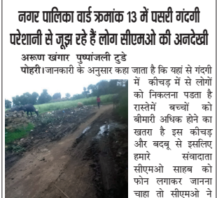
फोन उठाना मुनासिब नहीं समझा

अरूण खंगार पुष्पांजली टुडे पहरी। जानकारी के अनुसार कहा जाता है कि यहां से गंदगी में कीचड़ में से लोगों को निचलाना पड़ता है रास्तेमें बच्चों को बीमारी अधिक होने का खतरा है इस कोचड़ और बकवू से इसलिए हमारा संवादता सीएमओ साहब को फोन लगाकर जानना चाहते तो सीएमओ ने