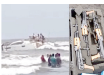
जांच एजेंसियां अल्टर पर, मुंबई में सुरक्षा कड़ी, महाराष्ट्र में अलर्ट