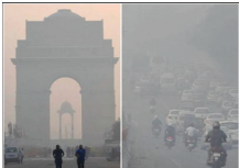
नई दिल्ली। वायु प्रदूषण पूर्व विश्व के लिए बड़ी आफत बनता जा रहा है। शहरों में वायु प्रदूषण और स्वास्थ्य पर हानि डुपट्टे इन्स्टीट्यूट की ओर से जारी नई रिपोर्ट के अनुसार दिल्ली और कोलकाता दुनिया के दो सबसे प्रदूषित शहरों में से एक हैं। दुनियाभर में 20 सबसे प्रदूषित शहरों में चीन के पांच तो भारत के तीन शहर शामिल हैं। इस रिपोर्ट में भारत की राजधानी को पीएम 2.5 के कारण प्रति 1 लाख आबादी में 106 मीटर के साथ 6वें स्थान पर रखा गया है। वहीं कोलकाता प्रति 1,00,000 लोगों में 99 मीटर के साथ 8वें स्थान पर आया है। चीन की राजधानी बीजिंग 2.5 के कारण होने वाली एसी 124 मीटर की

करें तो टीप 20 में एक भी भारतीय शहर शामिल नहीं है। पृथ्वीसी देश जगत का साधारण शहर का एनओ2 एयरपॉजिशन को लेकर सबसे बुरा हल रहा है। इस रिपोर्ट में चिंता की बात यह है कि दुनिया भर में बड़ी संख्या में वैश्विक शहरों में विश्व स्वास्थ्य संगठन (डब्ल्यूएचओ) के प्रति 2.5 एनओ2 दोनों के मानकों को पीएम 2.5 और एनओ2 दोनों में 2019 में दिल्ली का औसत पीएम 2.5 एक्सपोजर 110 माइक्रोग्राम प्रति क्यूबिक मीटर पाया गया, जो कि 5 माइक्रोग्राम प्रति क्यूबिक मीटर के स्वास्थ्य सुरक्षा मानकों का 22 गुना है। कोलकाता का औसत एक्सपोजर 84 माइक्रोग्राम प्रति क्यूबिक मीटर था।