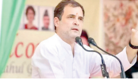
सिविल सोसायटी के लोगों से मुलाकात अहम मानी जा रही है। राहुल गांधी वार्गों के लिए काम करने वाले संगठनों और व्यक्तियों से मिलने जा रहे हैं। इसी क्रम में वोगेंद्र गादव, मेधा पाटकर सहित अन्य लोगों और संगठनों से संघर्ष साधा गया है। इसके अलावा भी 22 अगस्त को होने वाली मीटिंग के लिए बड़ी संख्या में लोगों से संघर्ष साधा जा रहा है। गौरतलब है कि 2014 से पहले डॉ. जे. जयप्रकाश काका के नेतृत्व वाले कई संगठनों ने तत्कालीन मनमोहन सिंह सरकार के खिलाफ माहौल बनाया था। तत्कालीन विपक्ष भाजपा के मुद्दों और अर्थव्यवस्था की स्थिति से संबंधित मुद्दों को उठाएंगे।

चखना पड़ा। लोकसभा चुनाव की तैयारी के तहत राहुल गांधी 22 अगस्त को सिविल सोसायटी के सदस्यों और संगठनों के साथ मुलाकात करने वाले हैं। कांग्रेस सांसद अनेक संगठनों के मुद्दों को सुनकर उनपर अपने विचार रखने वाले हैं। राहुल गांधी अपनी भारत जोड़ो यात्रा और इसके उद्देश्य पर भी सिविल सोसायटी के सदस्यों के साथ चर्चा करने वाले हैं। वहीं, राहुल गांधी की भारत जोड़ो यात्रा आगामी 7 सितंबर से कानपुर-दुमराई से शुरू होगी। अपनी यात्रा से पहले राहुल गांधी