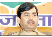
हाईकोर्ट ने कहा कि सभी तथ्यों को देखने से स्पष्ट होता है कि इस मामले में प्राथमिकी दर्ज करने के लिए पुलिस को आदेश दिया गया है। हाईकोर्ट ने पुलिस को तीन माह में जांच पूरी करने का निर्देश दिया है। बता दें कि साल 2018 में एक महिला ने शाहनवाज हुसैन पर दुष्कर्म का आरोप लगाया था। दिल्ली

नई दिल्ली। एक महिला ने वरिष्ठ भाजपा नेता और पूर्व केंद्रीय मंत्री शाहनवाज हुसैन पर दुष्कर्म का आरोप लगाया जिसके चलते वे नई मुम्बई में पड़ गए हैं। दिल्ली हाईकोर्ट ने दुष्कर्म के मामले में जांच नया नेता शाहनवाज हुसैन को राहत प्रदान करने से इनकार कर दिया है। हाईकोर्ट ने पुलिस को शाहनवाज हुसैन के खिलाफ दुष्कर्म सहित अन्य धाराओं में प्राथमिकी दर्ज करने का आदेश दिया है। साथ ही हाईकोर्ट ने दिल्ली पुलिस को तीन माह में जांच पूरी करने का निर्देश दिया है। बता दें कि साल 2018 में एक महिला ने शाहनवाज हुसैन पर दुष्कर्म का आरोप लगाया था। दिल्ली