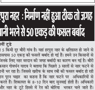
करोड़ रूपए खर्च कर दिए पर नतीजा सिफ्ट है। निर्माण इतना घटिया हुआ कि नहर जगह जगह टूट गई और नहर का पानी बहकर खेतों में भरने लगा है। यह नहर एपपी - युपी के बीच जाननी नदी में बनाई गई है।

दैनिक पुष्पांजलि टुडे की रिपोर्ट दत्तिया, 18 अगस्त 2022 मध्यप्रदेश शासन के गृह, जेल, संसदीय कार्य एवं विधि विधायी विभाग के मंत्री डॉ. नरायण ने दत्तिया प्रवास के दौरान आज पुष्पाव को टाऊनहॉल पर महिला सब्जी विक्रेताओं के पास पहुंचकर हाल-चाल जाना और सब्जी व्यवसाय से होने वाली आय के संबंध में भी चर्चा कर जानकारी ली। इस दौरान जनप्रतिनिधि आदि उपस्थित थे।