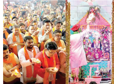
श्री बांके बिहारी मंदिर में हुआ महाआरती का भव्य आयोजन