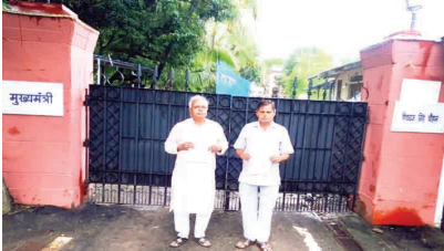
मुख्यमंत्री निवास तक पहुंचा मामला

केलारस। नगर के अंतर्गत वाई 7 में खोरी माता मंदिर व झरना वाले हनुमान मंदिर के बीच की आवासहीन गरीबों की बस्ती को उजाड़ने की कार्यवाही नहीं की जाए। इस मांग को लेकर मामला मुख्यमंत्री निवास तक पहुंच गया है। उक्त बस्ती में आवासहीन गरीबों के लगभग एक सैकड़ संज्या परिवार आवास करते हैं। यह परिवार विगत 10-15 बरसों से निवास करते हैं। यहां पर बुनियादी सुविधाओं का भी पूरी तरह अभाव है। पानी के पानी की