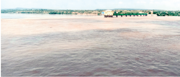
सुबह, दोपहर, शाम तीनों टाइम वहां जलस्तर, ग्रामीण घर छोड़े तो नहीं है तैयार

मुरैना। देश की प्रख्यात चंबल नदी बड़ो जलस्तर के कारण अब रौद्र रूप दिखा रही है और चंबल किनारे बसे एक सैकड़ गांव पानी को चपेट में आ गए हैं, लेकिन बावजूद इसके ग्रामीण अपने ठिकाने को छोड़ने तैयार नहीं हैं। प्रशासन एवं पुलिस द्वारा पिछले दो-तीन दिनों से ग्रामीणों को सुरक्षित स्थान पर जाने की सलाह दी जा रही है, लेकिन फिर भी ग्रामीण नहीं मान रहे। चंबल के बढ़ते