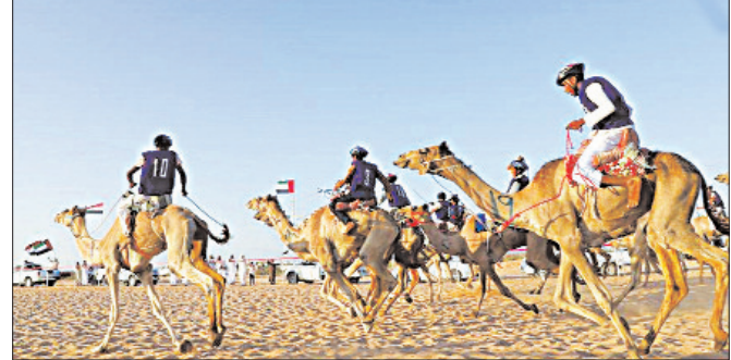
मिस्र में कैमल रेस (ऊट दौड़) में भाग लेते हुए प्रतियोगी।

दो या तीन सितंबर को आ जाएंगे। इससे पहले फीफा ने एआईएफएफ के कामकाज में हस्तक्षेप का आरोप लगाते हुए उसे निलंबित कर दिया था जिससे भारत की अंदाज 17 खिलाड़ियों का मेजबानी भी खतरे में पड़ गयी थी। इसके बाद शीर्ष अदालत ने केन्द्र की अपील पर प्रशासकों की समिति (सीओए) को बर्खास्त कर दिया था। जिससे सभी अधिकारी अब एआईएफएफ को मिल गये हैं।