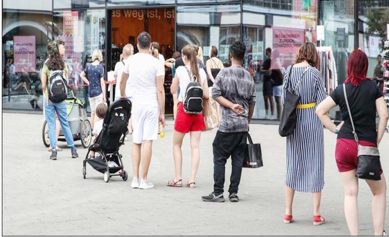
बर्लिन में कोरोना महामारी के कारण सामाजिक दूरी का पालन करते हुए एक दुकान के अंदर प्रवेश के लिए कतार में लगे लोग।