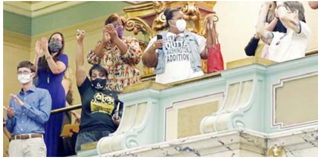
मिसौपी में सीनेट के सदस्यों ने एक कानून पास किया, इसके तहत राज्य के दुई में किसी भी बदलाव को रोकना आ सके।

रोकने के लिए और सांख्यिक डेटासिग को बढ़ाने के लिए यह फेसलाल लिया गया है। इस दौरान किसी भी प्रकार का कोई संभवित भी आयोजित नहीं किया जाएगा। अमेरिकी कमांडर ने कहा कि वह 2018 में इस नौसैनिक अभ्यास में हिस्सा लेने वाले देशों को फिर से आमंत्रित कर रहे हैं। बता दें कि दो साल के अंतराल पर होने वाले इस नौसैनिक अभ्यास में