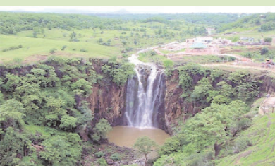
प्रतिबंधाल्मक आदेश जारी किया था। चोरल डैम, पातालपानी, सीतलामाता आदेश के तहत चोरल, चोरल नदी, फाल, मेहेदीकुंड, तिख फाल, कजलीगढ़, वाचू पाहट, जानापाव कुटी, कालाकुंड आदि स्थलों पर आम जनता की आवाजाही पूरी तरह बंद की गई थी। यह आदेश मधू क्षेत्र के थाना महू, किष्कानगंज, बडगोंडा, मानपुर, सिमरौल की सीमा में लागू किया गया था। इसी तहत सभी बालाबों एवं नदियों में मछुआरों का आवागमन, मछली पालन एवं उदक फेकने संबंधी गतिविधियां भी 15 दिन के लिए पूरी तरह प्रतिबंधित की गई थीं। सभी निस्तार घाटों पर संचालित होने वाली गतिविधियां भी पूरी तरह बंद की गई थीं। आदेश का उद्देश्य करने पर दंड प्रक्रिया संहिता की धारा-188 के तहत कार्रवाई का प्रतिबन्ध है। उल्लंघनीय है कि