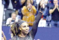
को ही जाएगी। सेरेना विलियम्स ने 2002 में फेंच ओपन में अपना पहला सिंगल्स खिताब जीता। इसके बाद अगले 15 सालों ने इस

अधिक समय तक चले मैच में अजला टॉमलजानोविच से 7-5, 6-7 (4), 6-1 से हार गईं। सेरेना ने 5 मैच खास्ट बचाए लेकिन उनमें से एक में जब उनका शॉट नेट पर लगा तो उनकी आंखें भी छटक उठीं। उन्होंने मैच के बाद मीडिया को कहा मैं उस हर व्यक्ति को आभारी हूँ जिसने सेरेना आगे बढ़े, कह कर मेरा हौसला बढ़ाया। सेरेना यूएस ओपन में पहली बार 1999 में खेली थी। तब वह केवल 17 साल की थी लेकिन अब वह शादीशुदा है और उनकी पांच साल की बिरिया भी है। सेरेना इस महीने 41 साल