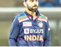
के साथ भिड़त को लेकर कोहली भी जमकर मेहनत कर रहे हैं। हालांकि पूर्व भारतीय कप्तान को आगामी भिड़त के लिए खास तैयारी से तैयारी कर रहे हुए देखा गया है।

नई दिल्ली। ब्रेक के बाद मैदान में उतर विराट कोहली का एक नया ही अंदाज देखने को मिला है। एशिया कप 2022 के अपने पहले मुक़ाबले में जहाँ उन्होंने पाकिस्तान के खिलाफ नाजुक परिस्थिति में 35 रनों को जुलूस पारी खेली। वहीं हांगकॉंग के खिलाफ उन्होंने अपना पुराना अंदाज दिखाते हुए अपना 59 नम बनाए। इस दौरान उनके बल्ले से एक चौकीने बल्लेबाजों को भी फाइनल छेड़ने निकाले। टीम का अगला मुक़ाबला अब एक बार फिर पाकिस्तान के साथ है। दोनों टीमों की भिड़त चार सितंबर को होने वाली है। आगामी मुक़ाबलों को लेकर दोनों टीमों ने कड़ी मेहनत करनी शुरू कर दी है। पाकिस्तान