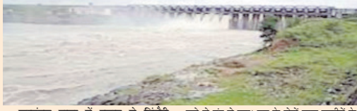
करमंडल नाला में उफान से डिंडौरी-अमरकंटक मार्ग चार घंटे रहा बंद; जिले के करंजिया जन्मद और बजग क्षेत्र में शनिवार की रात जागू से शुरू हुई कर-रककर तेस वर्षा का दौर रिवरवा की शास तक जारी रहा। वर्षा से क्षेत्र के नदी नाले उफान पर आ गए। जन्मद मुहालय करंजिया से महज तीन किलोमीटर दूर करमंडल नाले में आई बाढ़ के चलते पानी पुल के ऊपर आ गया। जंगलों में तेज वर्षा के कारण करमंडल नाला और उफान के चलते डिंडौरी से अमरकंटक मार्ग रिवरवा की दोपहर एक बजे से बंद हो गया। पुल के दोनों तरफ राहगीरों के वाहनों की लंबी कतार लग गई। रात पांच बजे तक इस मार्ग में आवागमन बंद रहा। पुल में पानी कुछ कम होने पर यहाँ यातायात बहाल हुआ। नमीदा नदी के उदम स्थल अमरकंटक आने वाले पर्यटक परिवार सहित पेशराम देखे गए। इसी तरह तुड़ार नदी में आई बाढ़ के चलते करंजिया से चौरादादर गांव के बीच अलग अलग तीन जगह पुल के ऊपर से पानी बहने के चलते यह मार्ग भी लगभग तीन घंटे से अधिक समय तक बंद रहा।

जबलपुर। डिंडौरी और मंडला में बीते 24 घंटे के दौरान हुई बरसात ने बरगी बांध का जलस्तर बढ़ा दिया। इस वजह से बांध के तीन गेट फिर खोल दिए गए हैं। बरगी बांध कंट्रोल रूम से मिली जानकारी के अनुसार ऊपरी इलाकों में हुई वर्षा की वजह से बांध का जलस्तर 422.55 मीटर को छू चुका है। बांध में पानी की आवक 486 क्यूमेक है। जबकि पावर हाउस और बांध के गेटों से 413 क्यूमेक पानी छोड़ा जा रहा है। बांध में पानी की आवक बढ़ने से तीन गेटों को आधा-आधा मीटर खोल दिया गया है। बांध प्रबंधन का कहना है कि फिलहाल बांध के तीन गेट खुले रखे जाएंगे। सोमवार को मौसम और मंडला-डिंडौरी में होने वाली वर्षा को देखकर गेटों को और खोलने या खुले गेटों को बंद करने का निर्णय लिया जायेगा। बांध के गेट खोलने जाने से नमीदा तटों पर आसिक्त रूप से जलस्तर बढ़ सकता है, लेकिन मौसम विभाग ने अगले 24 घंटों में वर्षा की संभावना व्यक्त की है, ऐसे में नमीदा तटों के आस-पास लोगों से सावधानी बरतने के लिए कहा गया है। प्रशासन ने पानी से सुरक्षित दूरी बनाए रखने के लिए कहा है।