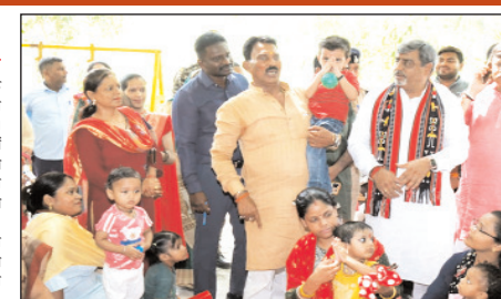
कार्यक्रम में शामिल महिलाओं से भी उन्होंने आंगनबाड़ी केन्द्र के संचालन के संबंध में विस्तार से चर्चा की। प्रभारी मंत्री एवं ऊर्जा मंत्री ने बच्चों को फ्लोराल एवं