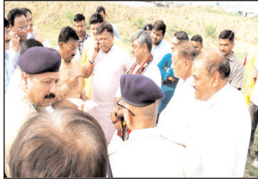
आयोजन भी शामिल न हो। मंत्री इन्द्र ने परसतत को प्यान में रखकर कार्यक्रम स्थल पर पण्डाल आदि की व्यवस्था करने के निर्देश दिए।

जायजा लिया। साथ ही समारोह की सभी तैयारियों समय-समय पर के भीतर पूर्ण करने के निर्देश संबंधित अधिकारियों को दिए। प्रभावी मंत्री श्री सिलावट ने कहा कि एलीवेटेड रोड़ गवालियरवासियों के लिये बहुत बड़ी सीमागत है। इसलिए शुभारंभ समारोह का आयोजन पूरी गरिमा व भव्यता के साथ किया जाए। एलीवेटेड रोड़ के शुभारंभ कार्यक्रम में शामिल होने आने वाले नागरिकों को कोई कटिनाई नहीं आनी चाहिए। ऊर्जा मंत्री श्री तोमर ने इस अवसर पर कहा कि गवालियर शहर के लिए एलीवेटेड रोड़ निर्माण से न केवल शहर की लातपात व्यवस्था बेहतर होगी, अर्थात् शहर एक महानगर का रूप लेगा। इसलिए सड़क के पहाड़ को प्यान में रखकर समारोह की सभी व्यवस्थाओं को इस प्रकार से अंजाम दें, जिससे जिलेवासी सुगमतापूर्वक समारोह में पहुँचकर ऐतिहासिक पलों के साक्षी बन सकें। साथ ही सड़क