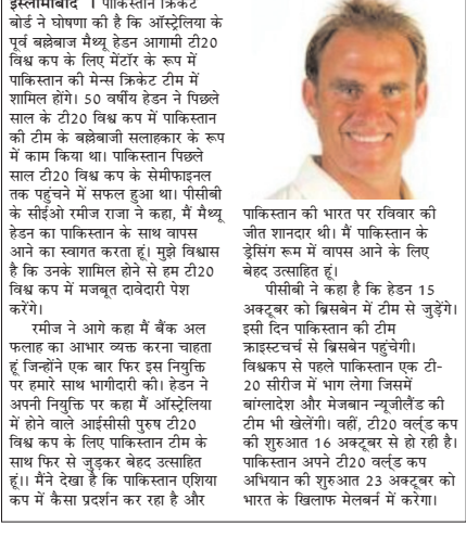
पाकिस्तान की भारत पर रिविवा की जीत शानदार थी। 'मैं पाकिस्तान के डेसिंग रूम में वापस आने के लिए बेहतर उत्साहित हूं। पीसीबी ने कहा है कि हेडन 15 अक्टूबर को ब्रिसबेन में टीम से जुड़ेंगे। इसी दिन पाकिस्तान की टीम क्राइस्टचर्च से ब्रिसबेन पहुंचेगी। विश्वकप से पहले पाकिस्तान एक टी-20 सीरीज में भाग लया जिसमें बांग्लादेश और मेजबान न्यूजीलैंड की टीम भी खेलेंगी। वहीं, टी20 वर्ल्ड कप की शुरुआत 16 अक्टूबर से हो रही है। पाकिस्तान अपने टी20 वर्ल्ड कप अभियानों की शुरुआत 23 अक्टूबर को भारत के खिलाफ मैलबर्न में करेगा।

इस्लामाबाद । पाकिस्तान क्रिकेट बोर्ड ने घोषणा की है कि ऑस्ट्रेलिया के पूर्व बल्लेबाज मैथ्यू हेडन आगामी टी20 विश्व कप के लिए मैटार के रूप में पाकिस्तान को मैस क्रिकेट टीम में शामिल होंगे। 50 वर्षीय हेडन ने पिछले साल के टी20 विश्व कप में पाकिस्तान की टीम के बल्लेबाजी सलाहकार के रूप में काम किया था। पाकिस्तान पिछले साल टी20 विश्व कप के सेमीफाइनल तक पहुंचने में सफल हुआ था। पीसीबी के सीईओ रमोज राजा ने कहा, 'मैथ्यू हेडन का पाकिस्तान के साथ वापस आने का स्वागत करता हूं। मैथ्यू विश्वास है कि उनके शामिल होने से हम टी20 विश्व कप में मजबूत दावेदारी पेश करेंगे।