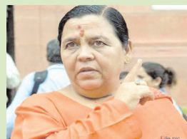
बात की, भाफी मांगी। फिर भी पार्टी ने कार्यवाही की। तब मैंने समझाया कि पार्टी ने नुपूर शर्मा पर भी कार्यवाही की है। ये मत कही कि इसमें कोई भेदभाव हुआ है। जाति और व्यक्ति विशेष को गाली देने को मैं निंदा करती हूँ।