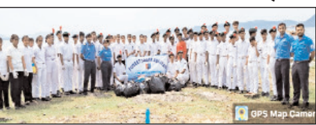
दूरिात जल से होने वाली समस्याओं के बारे में भी विस्तारपूर्वक जानकारी दी गई। साथ ही बांध के आसपास सदा स्वच्छता बनाये रखने के लिए लोगों को प्रेरित किया गया। स्थानीय निवासियों को समझाया गया कि दूषित पानी पीने से विभिन्न प्रकार की मौसमी बीमारियों पनपती हैं। इसलिए पेयजल स्रोतों को हमेशा साफ-सुधरा रखना चाहिए। इस अवसर पर कैडेटों ने नुकड़ नाटक, पोस्टर, भाषण आदि के माध्यम से लोगों को जागरूक किया।

ज्वालियर। पुनीत सागर अभियान के तहत एनसीसी की 3 मध्यप्रदेश नेवल युनिट के लगभग 125 कैडेट्स ने रविवार को तिघरा बांध के तटीय क्षेत्र एवं आसपास के परिसर में साफ-सफाई की गई। ज्वालियर गहर की पेयजल व्यवस्था के सबसे बड़े स्रोत तिघरा बांध के पानी को साफ रखने एवं जन-जन को जल संयंत्र में स्वच्छ रखने का संदेश देने के उद्देश्य से एनसीसी कैडेट्स द्वारा यह सामूहिक सफाई कार्यक्रम आयोजित किया गया। इस अवसर पर स्वच्छता रैली भी निकाली गई। इस दौरान नेवल युनिट एनसीसी के कैडेटों द्वारा तिघरा बांध के आसपास के निवासियों को