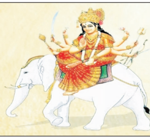
सूर्योदय से लगभग ढाढ़ घंटे पहले ही हो जाएगा। उसरा फाल्गुनी नक्षत्र और शुक्ल योग में सूर्योदय होगा। सुबह 07 बजकर 03 बजे के बाद हस्त नक्षत्र लगेगा। कनका स्थाना के लिए उत्तरा फाल्गुनी और हस्त दोनों ही नक्षत्र

जिन गृहस्थों को धन की कमी महसूस होती हो, उन्हें माता लक्ष्मी की उपासना में कनकभार सौत लक्ष्मी सोत श्रौस्तिक के पाठ से उपासना करनी चाहिए। बच्चों में शिक्षा