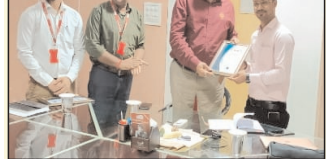
गवालियर। आज के समय में परसनिर्देशित डबलपैजमेंट एवं पब्लिक स्प्रीकिंग फिक्टर को दूर करना अत्यावश्यक है, ताकि हम सब अपने व्यक्तित्व को निष्कार सकें। यह बात श्रीमंत कलेज बानामोर में टेक टूथपूट ड्राफ्ट आर्योजित परसनिर्देशित डबलपैजमेंट एवं पब्लिक स्प्रीकिंग पर सेमिनार में मोर्टीवेरलत परसनिर्देशित चर्चा रहीं थी। इस समारोह में मुख्य अतिथि के रूप में मोर्टीवेरलत परसनिर्देशित चर्चा रहीं थी। इस समारोह में मुख्य अतिथि के रूप में मोर्टीवेरलत परसनिर्देशित चर्चा रहीं थी।