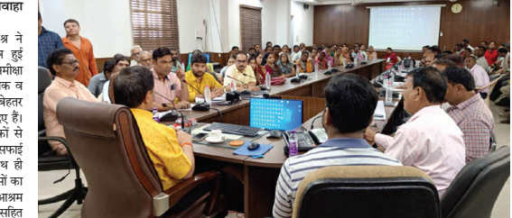
किचन में प्लेटमार्म और डाइनिंग हॉल सुविधा के लिए भी आवश्यक निर्देश दिए गए। उन्होंने कहा कि आवश्यक होने पर जनसहयोग के माध्यम से भी व्यवस्थाएँ दुरुस्त करें। प्रातिसर्घों के आधार पर छात्रावासों की रैंकिंग जारी करने एवं आगामी गणतंत्र दिवस के मौके पर पुरुस्कृत करने की बात कही। उन्होंने कहा कि छात्रावास में पढ़ाई के लिए निवासरत बच्चों के प्रति सदैव पर व परिवार के बच्चों जैसा अर्च्छ व्यवहार करें। विद्यार्थियों के अभिभावकों के सतत संपर्क में रहें। बच्चों को नियमित रूप से मार्गदर्शन प्रदान कर प्रेरित करें।