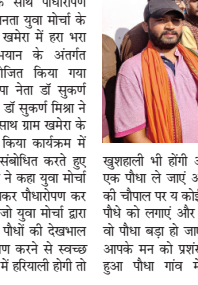
खुशहाली भी होगी आप सभी ग्रामवासी एक-एक पौधा ले जाओ और खेत पर या ग्राम की चौपाल पर व कोई खाली प्राणण है उसमें उस पौधे को लगाएँ और उसकी देखभाल करें जब नौ पौधा बढ़े जो जाएँ और हरियाली देगा तो आपके मन को प्रसन्न होगी कि हमारा लगाया हुआ पौधा गाँव में हरियाली होगा तो