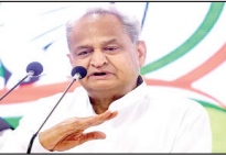
सिपाही के रूप में काम किया। सोनिया जी के आशीर्वाद से मैं तीसरी बार राजस्थान का मुख्यमंत्री बना। दो दिन पहले जो घटना हुई उसने मुझे हिला कर रख दिया। मुझे उसका बड़ा दुख हुआ है।' अशोक गहलोत ने कहा कि मैंने सोनिया जी से माफी मांगी है। उन्होंने आगे कहा कि विधायक दल की बैठक में एक लाइन का प्रस्ताव पारित करना मेरी नैतिक जिम्मेदारी थी। मैं उसे कर ही नहीं पाया। इस माहौल में मैंने

नई दिल्ली। कांग्रेस अध्यक्ष चुनाव में उम्मीदवारों को लेकर जारी असमंजस के बीच अब राजस्थान के मुख्यमंत्री अशोक गहलोत चुनाव नहीं लड़ेंगे। समाचार के मुताबिक, अशोक गहलोत ने कहा कि वह कांग्रेस अध्यक्ष का चुनाव नहीं लड़ेंगे। इतना ही नहीं, सोनिया गांधी के आवास 10 जनपथ पर उनसे मुलाकात के बाद गहलोत ने यह भी कहा कि वह मुख्यमंत्री पद का फैसला सोनिया गांधी करेंगी दरअसल, अशोक गहलोत की दिल्ली में कांग्रेस की अंतरिम अध्यक्ष सोनिया गांधी से कांग्रेस डेढ़ घंटे तक मुलाकात हुई। इसके बाद राजस्थान के मुख्यमंत्री अशोक गहलोत ने गुरुवार को कहा, 'मैंने कांग्रेस के लिए वफादार