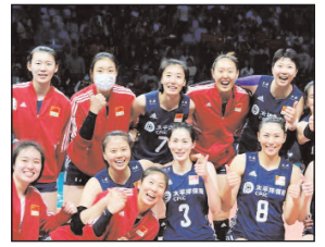
पृष्ठ 8 ■ मूल्य : 2 रु.