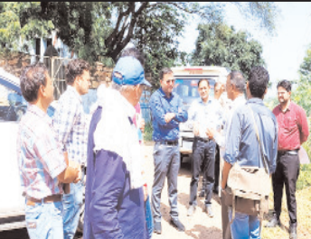
अमृत सरोवर, सामुदायिक स्वच्छता परिसर, प्रधानमंत्री आवास तथा मनरेगा के तहत चल रहे रोजगारमूलक कार्यों का जायजा लिया। लाम्बी वायरस से गैरबीबीए पत्रों को बचाने के लिये ग्राम पंचायत स्तर पर किए जा रहे टीकाकरण व उपचार व्यवस्था का भी उन्होंने जायजा लिया। ध्रुपण के दौरान उन्होंने संबोधित ग्राम पंचायत सचिवों को निर्देश दिए कि अमृत

जिला पंचायत सौईओ ग्रामीण अंचल में पहुँचें अमृत सरोवर सहित अन्य योजनाओं के तहत निर्माणधीन कार्यों का निराकरण