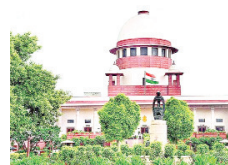
के द्वारा हिंसा किया जाना एक अर्थ है। ऐसे मामलों में महिला जबरन प्रेगनेंसी हो सकती है। अदालत ने कहा कि इस तरह विवाहित नियमों के मुताबिक तलाक़, विधवा

कहा कि विवाहिता महिला को तरह ही अविवाहित युवती की विना किसी की मंजूरी के 24 सप्ताह तक गर्भपात करा सकती है। अदालत ने इस दौरान साथ तोपर कहा कि विवाहित हो या फिर अविवाहित महिला सभी को सुरक्षित असीरन का अधिकार है। महिलाओं के गर्भपात और शरीर पर अधिकार को लेकर सुप्रीम कोर्ट ने यह बड़ा फैसला किया है। जस्टिस डीवाई चंद्रचूड़ की अध्यक्षता वाली बेंच ने कहा, 'अविवाहित महिलाएं भी रेप वॉरिंटो हो सकती हैं। रेप का अर्थ होता है कि बिना सहमति के संबंध बनाया और पाठन