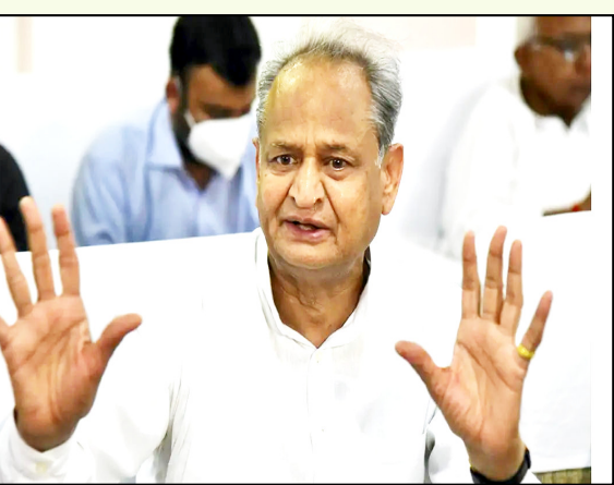
बना रहे। राजस्थान का केस अलग हो गया। यह तो हिस्ट्री में लिखा जाएगा। गहलोत बोले- डेटासरा ने विधायकों को मनाने

गहलोत ने रविवार को कहा- जब यह लगा कि मैं अध्यक्ष बन जाऊंगा तो नया सीएम आएगा। इससे 102 विधायक इस कदर भड़क गए कि उन्होंने किसी की नहीं मानी। उन्हें इतना क्या भय था? ऐसा क्यों हुआ, क्या कारण रहे, इस पर तो रिसर्च करना चाहिए। ऑब्जर्वर को भी चाहिए कि वे कांग्रेस अध्यक्ष की सोच, व्यवहार के ढंग से काम करें, ताकि वह और