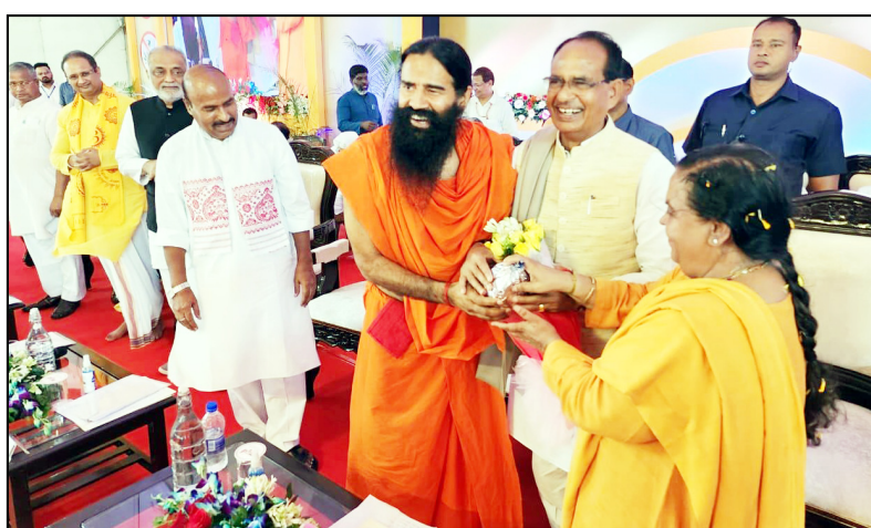
बनाएंगे की समाज को कोई नुकसान ना हो। सीएम ने कहा कि हुक्का लाउंज जैसी चीज नहीं चलेगी। अवैध नशे के कारोबारी पर अब कठोर कार्रवाई होगी।

प्रदेश में नशामुक्ति अभियान की शुरुआत दो अक्टूबर से महात्मा गांधी और पूर्व प्रधानमंत्री लाल बहादुर शास्त्री की जयंती के साथ शुरू हो गई है। यह अभियान आगामी 30 नवंबर तक जारी रहेगा। नशामुक्ति अभियान की शुरुआत लाल परेड ग्राउंड से एक सार्वजनिक कार्यक्रम में मंच से की गई। जिसमें शिवराज ने कहा कि राज्य शासन ने प्रदेश को नशे से मुक्त करने के लिए प्रदेशव्यापी नशामुक्ति अभियान चलाने का निर्णय लिया है। हम अपनी आबकारी नीति ऐसी बनाएंगे जिसके कारण नशे को बढ़ावा ना मिले। हम अपनी आबकारी नीति इस तरह