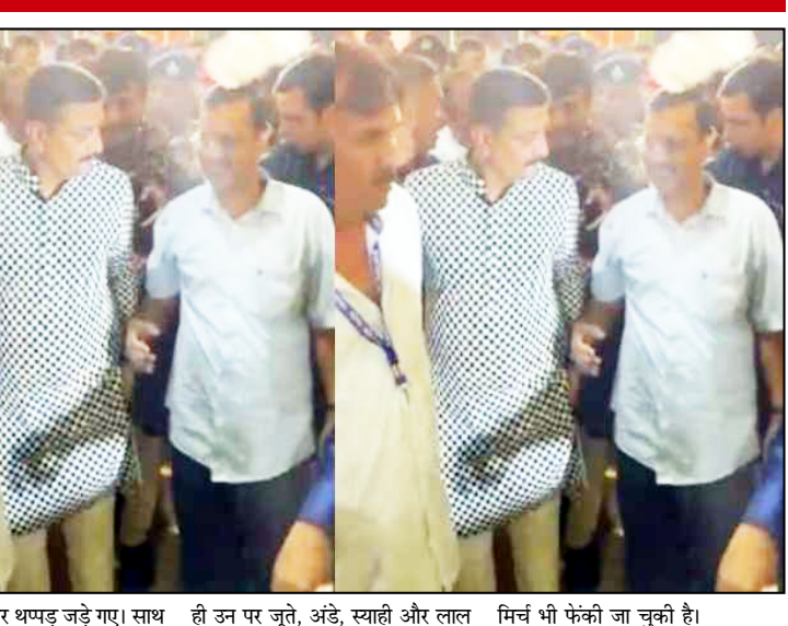
तक उन्हें कई बार थपड़ जड़े गए। साथ ही उन पर जूते, अंडे, स्याही और लाल मिर्च भी फेंकी जा चुकी है।

यह पहला मौका नहीं है, जब केजरीवाल पर सार्वजनिक तौर पर हमला हुआ हो। 2014 से लेकर अब तक उन्हें कई बार थपड़ जड़े गए। साथ ही उन पर जूते, अंडे, स्याही और लाल मिर्च भी फेंकी जा चुकी है।