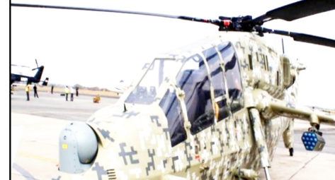
किया जा चुका है परीक्षण अधिकारियों ने रविवार को बताया कि इस हेलीकाप्टर को जोधपुर स्थित वायुसेना के ठिकाने

(एलसीएच) को औपचारिक रूप से अपने बेड़े में शामिल करेगी। इससे वायुसेना की ताकत में और वृद्धि होगी क्योंकि यह बहुयोगी हेलीकाप्टर कई मिसाइलें दागने और हथियारों का इस्तेमाल करने में सक्षम है। एलसीएच को सार्वजनिक उपक्रम हिंदुस्तान एयरोनॉटिक्स लिमिटेड (एचएएल) ने विकसित किया है और इसे ऊंचाई वाले इलाकों में तैनात करने के लिए प्राथमिक रूप से डिजाइन किया गया है।