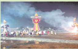
स्थानों व कालोनियों में पेट्रोल व पटाखों का सहारा लेकर रावण, कुंभकर्ण और मेघनाथ के पुतलों का दहन किया गया। रावण दहन के आयोजन शाम छह बजे से शुरू होने थे, जो आठ बजे तक आरंभ हो सके, तब कहीं जाकर

पर आयोजित रावण दहन कार्यक्रम में शामिल हुए, बारिश के बाद भी विश्वास सारंग ने सभा को संबोधित किया, वहीं दर्शकों ने पानी से बचने के लिए सिर पर कुर्सी लगा ली थी। टीटी नगर और बिन्दू मार्केट दशहरा मैदान पर अतिथियों के दौरान पटाखे फूटते तो चिंगारियां बैठे लोगों पर गिरा। इससे लोग कुर्सियों से भागते दिखे। इससे भगदड़ मच गई, हालांकि इन घटनाओं से कोई जनहानि नहीं हुई। वहीं, मोतीलाल विमान महाविद्यालय मैदान पर वर्षा से भीमने से रावण के पुतले को गंदे गिर गए। बिन्दू मार्केट में रावण का पुतला गिर गया। कुंभकर्ण, मेघनाथ के पुतले हर साल का तह हू-धू करके नहीं जले सके। इसी तरह अयोध्या नगर, अवधपुरी, छोला, कजलीखंडा, बंजारी कोला, कलियासांत, भेल दशहरा मैदान सहित अन्य सांस्कृतिक