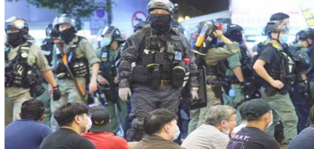
हंगकॉंग में नये सुरक्षा कानून का विरोध करने वाले प्रदर्शनकारियों को रोकने का प्रयास करते हुए पुलिस।

उपकरण नजर रही है। ऐसे में भारत के प्रतिकूल कदम का इस्तेमाल चीन की कंपनियों पर भी पड़ना तय है। एक अनुमान के मुताबिक भारत में वर्ष 2019 में 200 ऐप में 38 प्रतिशत चीन के हैं। चीनी ऐप भारत से अंगड़ा इतने नुकसान का अंदाजा लगाया जा रहा है तो समझा जा सकता है कि 59 ऐप के बैन होने से चीन को कितना बड़ा आर्थिक झटका लगेगा। ग्लोबल टाइम्स भारत के फैसले को लेकर हमलावर रहा है। उसने कहा है कि भारत में चीनी