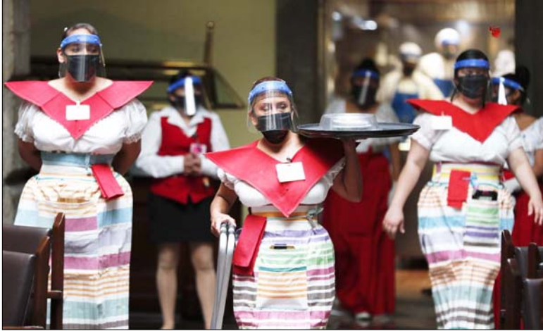
मैक्सिको में कोरोना वायरस संक्रमण रोकने के लिए फेश शील्ड और मारक लगाकर खान लेकर जाती हुई एक वेट्रेस।