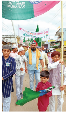
मुस्लिम समुदाय के लोग सुबह से ही जुलूस में पहुंचे। जुलूस में तिरंगा और झंडे लेकर चल रहे थे। जुलूस मस्जिद से शुरू होकर देवभोग के गली चौहाल होते हुए देवभोग के हदय स्थल से गुजरा। युवाओं ने जगह-जगह स्टाफर मोहम्मद साहब के नारे लगाए। इस दौरान तकरीर की और शुल्क व नगर में अमन-चैन की दुआ मांगी। मोहम्मद साहब के जन्मदिन पर उनके दिखाए रास्ते पर चलने का संकल्प लिया। सुरक्षा के लिए चपे-चपे पर पुलिस बल तैनात रहा। जुलूस निकलते ही देवभोग के वातावरण सुगन्धित हो गई प्रतिक हो रहा था जैसे कोई सकारात्मक ऊर्जा चारों तरफ विद्यमान हो रहा हो। देवभोग में मुस्लिम समुदाय एकता व भाईचारे के प्रतीक माने जाते हैं। निहायरा, शरीव, निस्कत लोगों के सेवा के लिए हमेशा कदम से कदम मिलाकर चलते हैं। देवभोग मुस्लिम समुदाय हृदय से क्षेत्र में अच्छे कार्य व सेवा कार्य में हथ बटाने के लिए मुस्लिम रूप से जाने जाते हैं। अमन चैन और भाईचारे के साथ क्षेत्र में हमेशा से देवभोग में मुस्लिम समुदाय एक अनाइका संदेश के साथ क्षेत्र के लोगों के हृदय में बसा हुआ है।

रिपोर्टर हेमचंद्र नागेश पुष्पांजली टुडे देवभोग-चमन-चमन, कली-कली, अली अली अली इश्क मोहब्बत-इश्क मोहब्बत आता हजरत-आला हजरत..., सरकार की आमाद परबन्ना-आका की आमाद महरबा... को गुंज से देवभोग क्षेत्र गुंजायमान हो गया। पैंगर हजरत मोहम्मद साहब के जन्मदिन गानों ईद ए मिलादुन्नबी पर रविवार को जुलूस निकाला गया। मुस्लिम समुदाय के लोग सुबह से ही जुलूस में पहुंचे। जुलूस में तिरंगा और झंडे लेकर चल रहे थे। जुलूस मस्जिद से शुरू होकर देवभोग के गली चौहाल होते हुए देवभोग के हदय स्थल से गुजरा। युवाओं ने जगह-जगह स्टाफर मोहम्मद साहब के नारे लगाए। इस दौरान तकरीर की और शुल्क व नगर में अमन-चैन की दुआ मांगी। मोहम्मद साहब के जन्मदिन पर उनके दिखाए रास्ते पर चलने का संकल्प लिया। सुरक्षा के लिए चपे-चपे पर पुलिस बल तैनात रहा। जुलूस निकलते ही देवभोग के वातावरण सुगन्धित हो गई प्रतिक हो रहा था जैसे कोई सकारात्मक ऊर्जा चारों तरफ विद्यमान हो रहा हो। देवभोग में मुस्लिम समुदाय एकता व भाईचारे के प्रतीक माने जाते हैं। निहायरा, शरीव, निस्कत लोगों के सेवा के लिए हमेशा कदम से कदम मिलाकर चलते हैं। देवभोग मुस्लिम समुदाय हृदय से क्षेत्र में अच्छे कार्य व सेवा कार्य में हथ बटाने के लिए मुस्लिम रूप से जाने जाते हैं। अमन चैन और भाईचारे के साथ क्षेत्र में हमेशा से देवभोग में मुस्लिम समुदाय एक अनाइका संदेश के साथ क्षेत्र के लोगों के हृदय में बसा हुआ है।