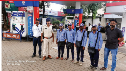
समन शुल्क वसुला गया 7 यातायात पुलिस द्वारा दोपहिया वाहन पर हेलमेट न लगाने वाले वाहन चालकों एवं यातायात नियमों का उल्लंघन करने वाले वाहन चालकों के खिलाफ तहत चालानी कार्रवाई कर कुल 10 चालान बनाए जिनसे कुल ? 2750