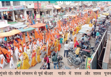
गुंजा रहे। शौर्य संचलन से पूर्व बीआर गाँडें में शस्त्र और शास्त्र पूजन

शस्त्र और शास्त्र पूजन के साथ गुरु हुआ कार्यक्रम, गुंजा जय श्रीराम का उद्घोष मुरैना। नवरात्र और विजयदशमी के उपलक्ष्य में विश्व हिंदू परिषद दुर्गावाहिनी-मातृशक्ति द्वारा शहर में शौर्य संचलन निकाला गया। सफेद सलवार-कुर्ता पर भगवा दूधड़ और भगवा ही साफा बांधे हुए सैकड़ों बालिकाओं व युवतियों जब सड़कों से गुजरती थी वातावरण हिंदुत्व के भाव और जय श्रीराम के नारों से गुंज उठा। इस दौरान जगह-जगह स्थानीय लोगों के पुष्प