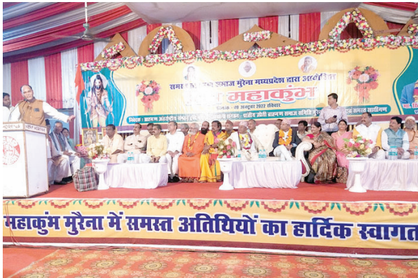
महाकुंभ मुरैना में समस्त अतिथियों का हार्दिक स्वागत