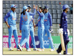
पृष्ठ 8 • मूल्य : 2 रु.