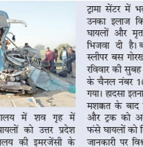
आयुर्विज्ञान विश्वविद्यालय में शव गूंच में रखवाया है। सभी घायलों को उत्तर प्रदेश आयुर्विज्ञान विश्वविद्यालय की इमरजेंसी के