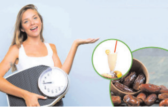
1. मसलस मजबूत बनाए: वजन बढ़ाने के लिए सबसे जरूरी है कि आप मसलस गेन करने वाली चीजों का स्वस्थ तरीके से सेवन करें। ताकि

आपका शरीर सुखी नजर आए। इसके लिए आपको केला और खजूर से बना मिल्कशेक जरूर पीना चाहिए क्योंकि इसमें भरपूर मात्रा में प्रोटीन और कार्ब्स पाए जाते हैं। इसके अलावा इसमें विटामिन और मिनरल्स पाए जाते हैं, जो शरीर को अंदर से मजबूत बनाते हैं। इसे आस सुबह के नाश्ते में ले सकते हैं।