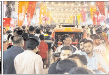
घर सजाने की सामग्री की दुकानों पर भी हुई खरीदारी

इसके साथ ही दीपावली पर बाजार में घर सजाने की सामग्री की दुकानों पर भी लोगों की भीड़ देखी गई। यह घर सजाने की आवश्यक सामग्री के साथ-साथ लोग बाजार में अन्य खरीदी की लेकर दुकानों पर देखे गए। मिष्ठान की दुकानों पर लोगों का हजेरा आज दीपावली त्योहार को लेकर उमड़ता और इसके साथ ही उपहार खरीदारी भी लोगों तकिक कई लोग दीपावली पर एक-दूसरे को तोहफे के रूप में उपहारों का भी आदान-प्रदान कर सके।