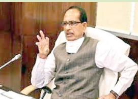
राजधानी नगरीय नगर निगम के अधिकारियों को तलब किया और बरसे।

चुकी सड़कों पर नाराजगी जाहिर की। जल्द से जल्द मरम्मत के निर्देश देते हुए उन्होंने रेस्टोरेशन नहीं करने वाले ठेकेदारों पर कार्रवाई करने को कहा।