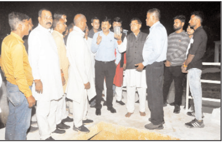
एमएलटी क्षमता के वाटर ट्रीटमेंट प्लांट का निरीक्षण कर जलप्रदाय की प्रक्रिया को देखा और संबन्धित अधिकारियों से पानी के पीने व मटले में रंग को लेकर जानकारी ली