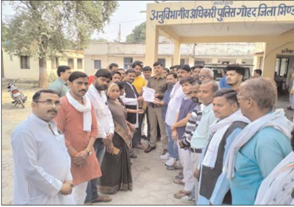
जोड़ो यात्रा के दौरान एक युवक द्वारा खुलेआम कट्टे से जानलेवा हमला करने

खिलाफ कोई बड़ी साजिश रचने का काम कर रही है। जिसका ताजा उदाहरण भारत का मामला सामने आया है। जापन में कहा कि स्थानीय पुलिस का मौके से नदारद