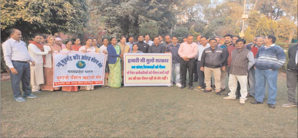
हमारी भी सुनो सरकार जब कर्मचारियों को पेंशन तो फिर कर्मचारियों को पेंशन क्यों नहीं जब की वार पेंशन नहीं तो वोट नहीं।

पूंजीपतियों को हो रहा है। पीएफआरडीए एकट के तहत नई पेंशन योजना को लागू किया गया जिसमें निवेशित रकम की किसी भी तरह की वापसी की गारंटी और कर्मचारियों के लिए निश्चित पेंशन का प्रावधान नहीं किया गया। एनपीएस किसी भी तरह से पेंशन योजना, ना होकर कर्मचारियों पर जबर्दस्ती लागू किया गया इन्वेस्टमेंट प्लान है। और इसको हड़प नीति कहे तो कोई अतिशयोक्ति नहीं होगी सेवानिवृत्त हो रहे कर्मचारियों को ना मात्र 1000 से 2000 रु पेंशन मिल रही है। वहीं अगर दूसरा पहलू देखें तो 2004 में जहाँ कर्मचारियों पर नई पेंशन योजना लागू की गई लेकिन आज तक विधायकों और सांसदों पर इसे लागू नहीं किया गया। जहाँ कर्मचारी सेवानिवृत्त होने के बाद में पेंशन का हकदार होता है वहीं विधायकों और सांसदों को एक दिन की सदस्यता के बाद भी पेंशन का हकदार बना दिया गया। दूसरा अगर कोई व्यक्ति 25 साल की उम्र में भी विधायक या सांसद बन जाता है और कुछ समय बाद इस्तीफा भी दे तो उसी समय से उनके लिए पेंशन का प्रावधान किया गया है। यह कर्मचारियों और टैक्सपेयर के पैसे का दुरुपयोग है पुरानी पेंशन बहाल की जाए एवं राष्ट्रहित में विधायकों सांसदों को मिल रही पेंशन को बंद किया जाए सभी वक्ताओं ने एक स्वर में कहा हमारी भी सुनो सरकार कर्मचारी अधिकारियों को पेंशन नहीं फिर विधायक सांसदों को पेंशन क्यों बैठक में उपस्थित कर्मचारियों द्वारा संकल्प लिया गया पेंशन नहीं तो वोट नहीं मुहिम को घर-घर तक ले जाएंगे की बैठक में हेमंत यादव बालूराम रावत राजेश सोनी जनक सिंह रावत वीरेंद्र सिंह रावत सहित सैकड़ों कर्मचारी उपस्थित रहे।