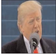
एलन मस्क को एक अच्छा इंसान बताया। उन्होंने उम्मीद जताई कि वे ट्विटर में जल्द जरूरी बदलाव करेंगे। एलन मस्क ने पिछले दिनों एक पोल कराया था। इसमें

समारोह में न जाने का निर्णय ट्विटर पर डाला। उस समय जो बाइडेन राष्ट्रपति पद की शपथ लेने वाले थे। ट्विटर ने ट्रंप पर भीड़ को उकसाने का आरोप लगाया और उनके अकाउंट को बैन कर दिया था। पहले यह बैन 12 घंटे के लिए था। बाद यह बढ़कर अनिश्चितकाल के लिए हो गया। हालांकि इस वापसी को लेकर ट्रंप ने खुशी नहीं जताई है। उनका कहना है कि वह अपने सोशल मीडिया ग्रुप ट्रुथ सोशल पर रहना पसंद करेंगे। हालांकि उन्होंने एलन मस्क को एक अच्छा इंसान बताया। उन्होंने उम्मीद जताई कि वे ट्विटर में जल्द जरूरी बदलाव करेंगे। एलन मस्क ने पिछले दिनों एक पोल कराया था। इसमें