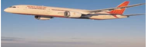
ऐसा मौका नहीं है कि जब कोई क्लाइट तकनीकी खराबी के कारण देरी से चली हो। इससे पहले एयर इंडिया की एक और फ्लाइट ने

कारण हुई। इससे पहले एक इंडिगो फ्लाइट को तकनीकी खराबी के कारण बीच रास्ते से लौटना पड़ा। यह एयरलाइंस कोलकाता से मुंबई की ओर जा रही थी। फ्लाइट को लौटाने के कुछ समय बाद ही लौटाना पड़ा। विमान में 156 यात्री मौजूद थे। इस फ्लाइट ने सुबह दस बजे नेलाजी सुभाष चंद्र बोस अंतरराष्ट्रीय हवाई अड्डे से उड़ान भरी थी। कुछ समय के बाद ही विमान के पायलट ने तकनीकी खराबी के कारण विमान को वापस लाने की इजाजत मांगी। फ्लाइट को दोबारा कोलकाता एयरपोर्ट पर लाया गया।