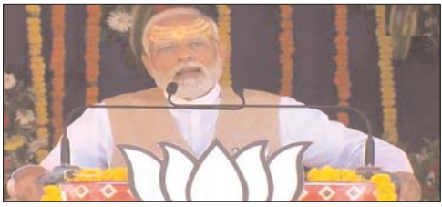
चुनाव को 2024 के लोकसभा में पूरी ताकत झोंक दी है। क्योंकि गुजरात प्रधानमंत्री नरेंद्र मोदी का चुनाव के सेमिफाइनल मानकर

गुजरात भी है, इसलिए बीजेपी के लिए गुजरात चुनाव प्रतिष्ठा का सवाल बना हुआ है। हालांकि यहां लंबे समय से बीजेपी की सरकार है। इसबार खास बात यह है कि गुजरात चुनाव में आम आदमी पार्टी ही हिस्सा ले रही है। दिल्ली और पंजाब के बाद आम आदमी पार्टी गुजरात को अपना नया ठिकाना मानकर चल रही है। वहीं, कांग्रेस की बात करें तो गुजरात चुनाव पार्टी के नए अध्यक्ष महित्कारुन खड्के के लिए अभिनवप्रवेश से कम नहीं है।