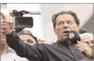
कहा, मुझे भारत का उदाहरण लेना चाहिए, जो हमारे साथ-साथ आजाद हुआ था। अब इसकी विदेश नीति को देखें। यह एक स्वतंत्र और स्वतंत्र विदेश नीति का अनुसरण करता है। भारत अपने निर्णयों के पक्ष में डट कर खड़ा रहता है कि अपने नागरिकों के हित में रूस से तेल खरीदे।

इस्लामाबाद। पाकिस्तान के पूर्व प्रधानमंत्री इमरान खान ने फिर से भारत की विदेश नीति की तारीफ की है। पाकिस्तान तहरीक-ए-इस्लाम के अध्यक्ष इमरान खान ने शनिवार को वरुंचल माध्यम से अपने लांग मार्च को संबोधित करते हुए कहा कि भारत की विदेश नीति स्वतंत्र और स्वतंत्र है। एएनआई के मुताबिक रूस से तेल खरीदने के भारत के फैसले के बारे में बोलते हुए, खान ने