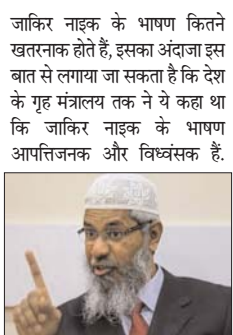
भारत सरकार ने साल 2016 में नाइक से संगठन इस्लामिक रिसर्च फाउंडेशन पर प्रतिबंध लगा दिया था। आरोप था कि इसी फाउंडेशन की आड़ में मनी लॉडिंग का भी खेल चल रहा था। गिरफ्तारी के डर से जाकिर नाइक मलेशिया भाग गया था। साल 2017 में उसे भगोड़ा घोषित कर दिया गया था। यही नहीं, साल 2021 में जब पाकिस्तान में

नई दिल्ली। कतर में फीफा वर्ल्ड कप के पहले दिन के मैच शुरू होने से पहले ही एक ट्वीट ने धमाका कर दिया। ट्वीट में जानकारी दी गई कि इस फुटबॉल वर्ल्ड कप में जाकिर नाइक दीनी व्याख्यान देंगे। दीनी व्याख्यान का मतलब है कि धर्म से जुड़े हुए भाषण। जैसे ही यह खबर भारतीयों को पता चली तो करोड़ों लोग सन्न रह गए। दरअसल, जाकिर नाइक भारत में भगोड़ा घोषित है। भारत में उसके ऊपर तमाम मुकदमे दर्ज हैं। इन मुकदमों में डेट स्पीच और आतंकवाद के लिए प्रेरित करने के भी मुकदमे हैं। मीडिया रिपोर्ट्स के अनुसार हाल में गिरफ्तार कई आतंकियों ने ये बताया था कि वह जाकिर नाइक का वीडियो देख आतंकवाद के रास्ते पर चले थे। इसके अलावा जाकिर नाइक पर मनी लॉडिंग, समाज में नफरत फैलाने जैसे मुकदमे दर्ज हैं।