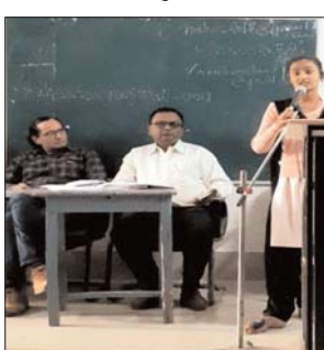
की गुणवत्ता पर आधारित जिला स्तरीय भाषण अवसर पर महाविद्यालय के प्राचार्य डॉ एच.