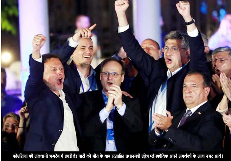
क्रोएशिया की राजधानी जगरेव में एचडीडे पार्टी की जीत के बाद उत्साहित प्रधानमंत्री एंड्रेज पतैनकोविच अपने समर्थकों के साथ नजर आये।