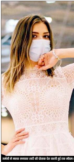
जर्मनी में नाटक लगाकर शादी की घोषणा पेश करती हुई एक महिला।

उमर। उत्तर-पश्चिम यमन में सप्ताह के अंत में सीरिय इस्लामिक विद्रोहियों ने संयुक्त राष्ट्र के एक हेलीकॉप्टर पर अंधाधुंध फायरिंग की जिसमें दो लोगों की मौत हो गई। यादगिरि मोस्मर बुद्धी ने हमले के लिए कट्टरपंथी मुहम्मद अल-शरारा और इरक के कड़े सैनिकों को जिम्मेदार ठहराया और इरक के लिए सैनिकों को चेतावनी भी दी। उमर में एक वाहन में कहा, 'लोकों हमले के अतिरिक्त हमें बचने से पूरी तरह निराश कर रहे हैं और अब हमें युद्ध की आवश्यकता है।' उत्तर-पश्चिम यमन में सत्तावादी कार्यकर्ताओं पर हमले बढ़ रहे हैं। यह अपने नामों को छुपाने और खुद को मजबूत दिखाने की उनकी निराला को प्रदर्शित करता है। उत्तर-पश्चिम यमन में सत्तावादी सैनिकों की सूझ हमला से ही एक पंजाब का विचार रहा है, जहाँ लोकों हमले कर रहे हैं और सत्तावादी कार्यकर्ताओं का अवहण और उनकी हत्या कर रहे हैं। शीतलक को हुए इस हमले की हत्याओं अभी तक किसी ने कोई जिम्मेदारी नहीं ली है। यमन में संयुक्त राष्ट्र के मानवाधिकार संचालक एल्विन कैलन ने कहा कि मुक्तों में पांच वर्षों तक एक बच्चा भी शामिल है। चालक दल के सदस्य सुरक्षित हैं और हमले के समय हेलीकॉप्टर में सत्तावादी कार्यकर्ताओं के साथ सत्तावादी विद्रोहियों के कारण 19 लोग लाल विस्थापित हुए हैं और संयुक्त राष्ट्र विश्व भोजन कार्यक्रम ने चेतावनी दी कि यहाँ करीब 30 लाख लोग भुखमरी में भी डूब रहे हैं।