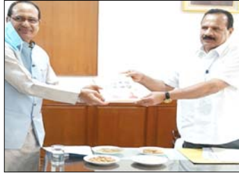
मीट्रिक टन यूरिया आवंटन की आवश्यकता है। केन्द्रीय मंत्री श्री सदानंद गोड़ा ने राज्य को

भोपाल। मुख्यमंत्री श्री शिवराज सिंह चौहान ने केन्द्रीय रसायन एवं उर्वरक मंत्री श्री डी.वी. सदानंद गोड़ा से नई दिल्ली में मुलाकात कर राज्य के लिए अतिरिक्त यूरिया आवंटन का अनुरोध किया। श्री चौहान ने कुल 5.75 लाख मीट्रिक टन अतिरिक्त यूरिया राज्य के लिए शीघ्र आवंटन करने की मांग की। श्री चौहान ने बताया कि माह जुलाई के लिए डेढ़ लाख मीट्रिक टन यूरिया और अगस्त से सितंबर तक के लिए 4.25 लाख