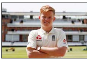
बल्लेबाज ने कहा कि दर्शकों के बिना भी क्रिकेट का स्तर प्रभावित नहीं होगा। उन्होंने कहा, 'भले ही हम थोड़ा सा संरोत बजायेंगे, मुझे पता नहीं है लेकिन हम अपना ही माहौल बनाने का तरीका तलाश सकते हैं।

साउथम्पटन। इंग्लैंड के बल्लेबाज ओली पोप ने कहा है कि वेस्टइंडीज के खिलाफ आठ जुलाई से शुरू होने वाले पहले क्रिकेट टेस्ट मैच के खाली स्टेडियम में होने से भी खेल को लेकर उत्साह कम नहीं होगा। कोरोना महामारी के खतरे को देखते हुए तीन टेस्ट मैचों की यह श्रृंखला खाली स्टेडियम में खेले जायेंगे। इसका दूसरा और तीसरा टेस्ट मैच मेनचेस्टर में 16 से 20 जुलाई और 24 से 28 जुलाई तक खेला जायेंगे। पोप ने इंग्लैंड के अभ्यास मैच के बाद कहा, 'जब काफी दर्शक होते हैं और 'बार्नो आर्मी' भी यहाँ होती है तो यह जानदार अनुभव होता है पर हम फिर भी टेस्ट क्रिकेट खेलेंगे।' उन्होंने कहा, 'अगर दर्शकों में एक भी व्यक्ति नहीं होगा तब भी हम उस क्रिकेट को खेलेंगे जिसका हमने अभी तक खेलने का सपना देखा है। टेस्ट अभी भी क्रिकेट का शीर्ष प्रारूप है। सुबह के समय अब भी बैसा ही जोत होगा क्योंकि इसमें कई कठिन हालातों से गुजरना होता है। जब टेस्ट में शुरू होता है तो दर्शक हॉ या नहीं, आप हमेशा उत्साहित रहते हो।' इस 22 साल के