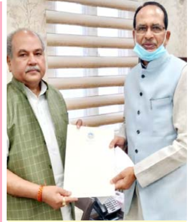
मुख्यमंत्री शिवराज सिंह चौहान ने मध्यप्रदेश के बासन्ती घावल को जी. आई टैग दिलवाने के संदर्भ में केन्द्रीय कृषि एवं किसान कल्याण मंत्री महेन्द्र सिंह तोमर को अनुबोध पत्र सौंपा।

कोविड 19 के कारण ईटौर, खण्डवा, छिन्दवाड़ा और इटारसी के रैक प्लांट्स पर अनलॉडिंग पर अधिक समय लगने के कारण प्रदेश के अन्य जिलों में यूरिया प्रदाय प्रभावित हुआ है। श्री चौहान ने प्रदेश में रैक प्लांट बढ़ाने की मांग की। इस अवसर पर मुख्यमंत्री श्री चौहान ने केन्द्रीय मंत्री को राज्य सरकार द्वारा दो पुस्तिकाओं - 'उम्मीद' और 'मध्यप्रदेश विकास के प्रतिबद्ध प्रयास' की प्रतियां भेंट कीं।