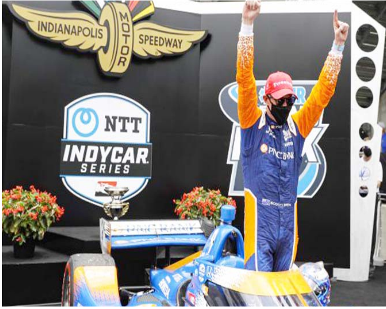
इंडियानापोलिस में न्यूज़ीलैंड के रेस ड्राइवर स्टेट डिवरान इंडीकार ऑटो रेस में जीत के बाद ज़रब मनाते हुए।