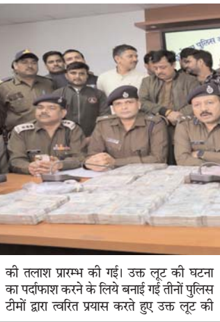
की तलाश प्रारम्भ की गई। उक्त लूट की घटना का पर्दाफाश करने के लिये बनाई गईं तीनों पुलिस टीमों द्वारा त्वरित प्रयास करते हुए उक्त लूट की

उसने अपने दो साथियों के साथ सोचे समझे प्लान के तहत उक्त लूट की घटना कारित करना स्वीकार किया। इस पर से पुलिस टीमों द्वारा उक्त आरोपियों