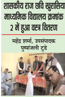
शासकीय राज छवि खुरासिया माध्यमिक विद्यालय क्रमांक 2 में हुआ वक्त्र वितरण