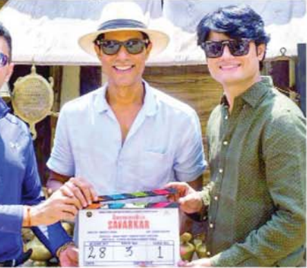
अनुपम खेर और गुरु रंधावा की तस्वीरें सोशल मीडिया पर वायरल हो गई हैं। खेर साब एक लीडर हैं (सर ये कल्लाना पसंद नहीं करते)। आप लोग एक गायक के रूप में मेरे लिए बहुत उदार और दयालु रहे हैं। अब मुझे एक अभिनेता के रूप में अपनी नई यात्रा में आपके प्यार और आशीर्वाद की जरूरत है। मैं बहुत मेहनत करने का वादा करता हूँ। मैं इससे बेहतर लॉन्च के लिए नहीं सोच सकता था। रब राखा!

लोकप्रिय पंजाबी गायक गुरु रंधावा अभिनय की दुनिया में कदम रखने और अनुभवही अभिनेता अनुपम खेर की 532वीं फिल्म से डेब्यू करने के लिए पूरी तरह तैयार हैं। अनुपम ने इंस्टाग्राम पर गुरु के साथ अपनी एक तस्वीर साझा की। उनकी पीठ कैमरे की तरफ है क्योंकि दोनों फिल्म की स्क्रिप्ट पढ़ रहे हैं। अनुभवही स्टार ने गायक के ट्रैक हाई रेटेड गबरू को भी बैकग्राउंड में बजते हुए सुना जा सकता है। उन्होंने इसे कैप्शन दिया, मैं अपनी 532वीं स्क्रिप्ट पढ़ रहा हूँ और यह उनकी पहली है! भले ही वह पहले से ही एक सुपर स्टार हैं। देवियों और सज्जनों! पेश है गुरु रंधावा - अभिनेता! उन्हें अपना प्यार और आशीर्वाद दें! जय माता दी! इसी तस्वीर को साझा करते हुए, गुरु ने लिखा, मैं इससे बेहतर लॉन्च के लिए नहीं सोच सकता था। मैं अपनी पहली स्क्रिप्ट पढ़ रहा हूँ और यह उनकी 532वीं है। उन्होंने कहा, मैं एक नया कलाकार हूँ और खेरसाब एक लीडर हैं (सर ये कल्लाना पसंद नहीं करते)। आप लोग एक गायक के रूप में मेरे लिए बहुत उदार और दयालु रहे हैं। अब मुझे एक अभिनेता के रूप में अपनी नई यात्रा में आपके प्यार और आशीर्वाद की जरूरत है। मैं बहुत मेहनत करने का वादा करता हूँ। मैं इससे बेहतर लॉन्च के लिए नहीं सोच सकता था। रब राखा!