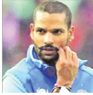
निर्बंधन में नहीं है और हम केवल उसके रकने उसका इंतजार करते हैं। अब तीसरे

हैमिल्टन। भारत और न्यूजीलैंड के बीच दूसरा एकदिवसीय मैच बारिश के कारण पूरा नहीं हो पाया और इसे रद्द कर दिया गया। इस मैच में भी युवा विकेटकीपर बल्लेबाज संजु सैमसन को अंतिम ग्राहक में जगह नहीं मिलने पर प्रशंसकों ने जमकर नाराजगी व्यक्त की है। इसी को लेकर अब टीम ड्रॉपिंग के कार्यवाहक कप्तान शिखर धवन ने सफाई दी है। धवन ने कहा है कि हम छठे गेंदबाज के साथ इस मैच में उतरना चाहते थे। यही कारण है कि संजु के स्थान पर दीपक हुडा को शामिल किया गया। वहीं दीपक चाहर को इसलिए लिया गया क्योंकि वह विंग करार सकते हैं धवन ने कहा कि बारिश हमारे