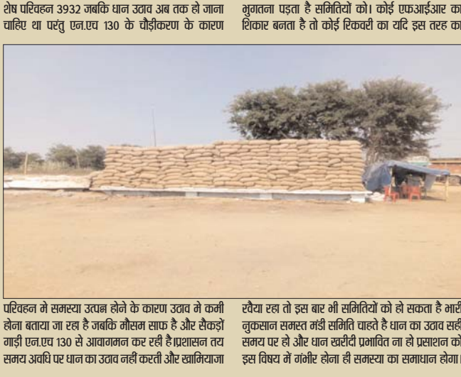
शेष परिवहन 3932 जबकि धान उठाव अब तक हो जाना चाहिए था परंतु एन.एच 130 के चौड़ीकरण के कारण मुगतना पड़ता है समितियों को। कोई एकआईआर का शिकार बनता है तो कोई रिकवरी का यदि इस तरह का रवेया रहा तो इस बार भी समितियों को हो सकता है गाड़ी नुकसान समस्त मंडी समिति चाहते है धान का उठाव सही समय पर हो और धान खरीदी प्रभावित ना हो प्रशासन को इस विषय में गंभीर होना ही समस्या का समाधान होगा।

संवाददाता हेमचंद्र नागेश देवभोग- धान खरीदी हुआ प्रभावित देवभोग ब्लॉक में सोसायटी कर्मी धान खरीदी से हरे रहे दूर 12 समितियों झाकरपाड़ा, झिरीपाणा ने किया खरीदी बंद तो अन्य समिति किसानों के दबाव में खरीदी करने पर हरे गजबूर। धान का समय पर उठाव नहीं होना समितियों के लिए सर दर्द बनता दिख रहा है। पड़ताल करने 8 समितियों ने पाया गया बफर लिमिट से ज्यादा धान लिफ्टगुड़ा बफर लिमिट 5000 कुल खरीदी 9904 कुल परिवहन 3150 परिवहन शेष 6754 देवभोग बफर लिमिट 5000 कुल खरीदी 12614 कुल परिवहन 5080 परिवहन शेष 7534 झाकरपाड़ा बफर लिमिट 5000 कुल खरीदी 16114 कुल परिवहन 7820 परिवहन शेष 8294 लाटापाड़ा बफर लिमिट 5000 कुल खरीदी 20117 कुल परिवहन 11790 परिवहन शेष 83027 झिरीपाणा बफर लिमिट 5000 कुल खरीदी 8552 कुल परिवहन 1990 परिवहन शेष 6562 झोकरपाड़ा बफर लिमिट 4000 कुल खरीदी 4820 कुल परिवहन 1640 परिवहन शेष 3180 रोहनागुड़ा बफर लिमिट 5000 कुल खरीदी 10940 कुल परिवहन 2900 परिवहन शेष 8040 दिवानगुड़ा बफर लिमिट 5000 कुल खरीदी 18565 कुल परिवहन 5410 परिवहन शेष 13155 गोहरापट्ट बफर लिमिट 4936 कुल खरीदी 17062 कुल परिवहन 13130