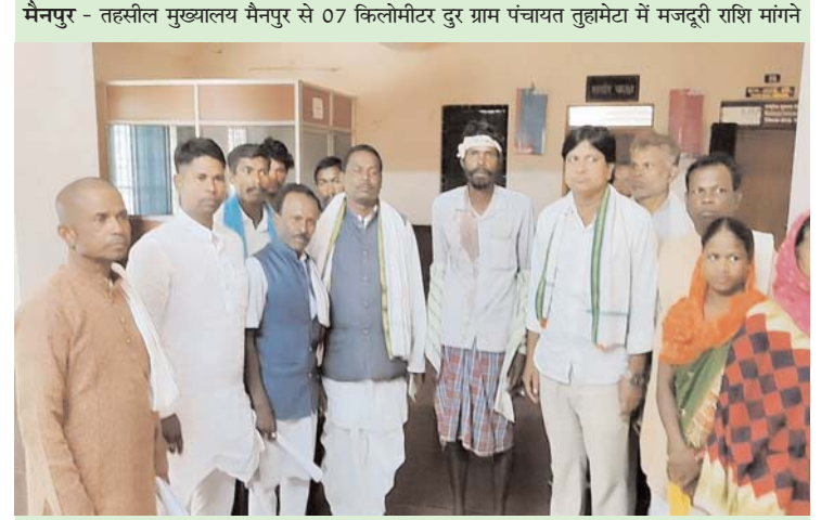
संवाददाता हेमचंद्र नागेश

एसटीएसी के तहत सचिव के खिलाफ मामला दर्ज कर जेल भेजने की मांग को लेकर पहुंचे जिला मुख्यालय