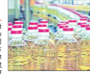
गया है। सूत्रों ने कहा कि देश में तेल तिलहन उद्योग की हालत सुधारने और देश को आत्मनिर्भरता की राह पर ले जाने की जिम्मेदारी तेल संगठनों को भी निभानी होगी और इसके लिए उन्हें समय रहते सरकार को जगोनी नरसुतस्थिति की जानकारी देनी चाहिए। सूत्रों के मुताबिक पिछले सप्ताहांत के मुकाबले बीते सप्ताह सरसों दाने का भाव 25 रुपए घटकर 7275-7325 रुपए प्रति क्विंटल पर बंद हुआ। सरसों दादरी तेल समीक्षाधीन सप्ताहांत में 100 रुपए

नई दिल्ली। बीते सप्ताह कमजोरी मांग की वजह से दिल्ली तेल-तिलहन बाजार में सरसों सोयाबीन मृगफली सहित अधिकतर तेल-तिलहन कीमतों में गिरावट देखी गई जबकि सबसे सरसता होने की वजह से वैश्विक मांग के चलते कच्चे पामतेल (सोपीओ) और पामोलीन तेल कीमतों में मजबूती दिखाई दी। देश में कोटा प्रणाली लागू होने की वजह से बाकी आयात प्रभावित होने से कम आपूर्ति की स्थिति पैदा होने के कारण सोयाबीन तेल (दिल्ली) के भाव में सुधार आया। बाजार के जानकार सूत्रों ने कहा कि लगभग छह माह पूर्व जिस सूरजमुखी तेल का भाव कांडला बंदरगाह पर 2500 डॉलर प्रति टन था वह विदेशों से आयातों में सुधार के कारण अब घटकर 1360 डॉलर प्रति टन रह गया है। सोयाबीन तेल से जिस सूरजमुखी तेल का भाव 350 डॉलर उंचा था वह अब सोयाबीन तेल के दाम के मुकाबले 100 डॉलर नीचे हो