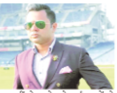
शामिल नहीं थे। करेन ने कई सालों से प्रभावित किया है। उन्होंने इस साल टी20 विश्व कप में शानदार प्रदर्शन किया और 'प्लेयर ऑफ द टूर्नामेंट' भी रहे। उन्होंने इस टूर्नामेंट में कुल 13 विकेट लिए थे। उन्होंने टूर्नामेंट में अफगानिस्तान के खिलाफ 5 विकेट लिए थे। वहीं स्टोक्स ने आईपीएल 2022 में नहीं खेला था। वहीं वह 2017 और 2018 के आईपीएल में सबसे महंगे खिलाड़ी में से एक थे।

नई दिल्ली। भारतीय क्रिकेट टीम के पूर्व क्रिकेटर आकाश चोपड़ा ने कहा है कि आईपीएल में ऑस्ट्रेलिया के कैमरून ग्रीन इंग्लैंड के सैम करेन और बेन स्टोक्स इस बार सबसे महंगे बिकने वाले खिलाड़ी होंगे। आईपीएल 2023 के लिए 23 दिसंबर को कोलिंब में मिनो निलामी होगी। आकाश ने ट्विटर पर लिखा अगर ग्रीन अपना नाम नीलामी के लिए खोलते हैं तो वो सबसे महंगे खिलाड़ी हो सकते हैं। वहीं करन दूसरे सबसे महंगे खिलाड़ी हो सकते हैं जबकि स्टोक्स तीसरे। यह नीलामी लोगों को हैरान भी कर सकती है। ग्रीन ने भारत के खिलाफ सिर्फ एक ही ट्वेंटी20 सीरीज में शानदार प्रदर्शन करते हुए 3 टी20 मैचों की सीरीज में 2 अर्धशतक लगाये थे हालांकि वह इस बार टी20 विश्व कप में