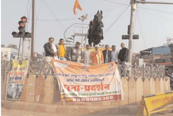
ग्वालियर गौले के मन्दिर पर वनी अस्थाई गोशाला में नही रख रखाव के समुचित

जिसके लिए हम गौ रक्षक धरना प्रदर्शन के माध्यम से सरकार से निवेदन कर रहे हैं