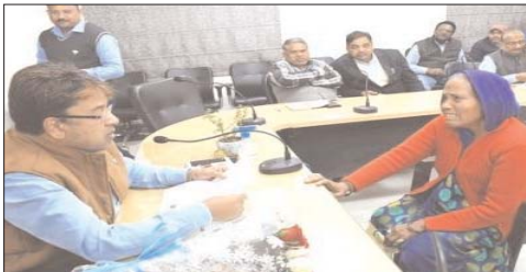
करने की तिथी बढाने के लिए अनेक हितग्राहियों द्वारा आवेदन दिया गया। निर्देश दिए गए। साथ ही नगर निगम के आउटसोर्स कर्मचारियों द्वारा कर्मचारी

योजना अंतर्गत मलिन बस्ती तथा गैर मलिन बस्ती के आवासों की राशि जमा जिसको लेकर संबंधित अधिकारी को नियमानुसार आवश्यक कार्रवाई के अधिकारी कल्याण परिषद के पत्र पर नगर निगम में कार्यरत आउटसोर्स कर्मचारियों की विभिन्न समस्याओं के निराकरण के साथ ही समय पर वेतन भुगतान एवं ईपीएफ का पैसा जमा कराने लिए मांग पत्र दिया। जिसको लेकर संबंधित अधिकारी को आवश्यक कार्रवाई के निर्देश दिए गए। इसके साथ ही जनसुनवाई में पेयजल, अतिरिक्त, सफाई, विद्युत, आवास, सौर सफाई आदि से संबंधित 26 से अधिक आवेदन प्राप्त हुए, जिनके निराकरण के लिए संबंधित विभागों अधिकारियों को आवश्यक कार्यवाही के निर्देश निगमायुक्त ने दिए।