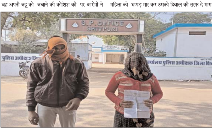
वह अपनी बहू को बचाने की कोशिश की पर आरोपी ने महिला को थपड़ मार कर उसको दिवाल की तरफ दे मारा