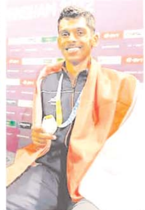
सातवें दिन भारतीय खिलाड़ियों ने किया बेहतरीन प्रदर्शन... सातवें दिन भारतीय खिलाड़ियों ने किया बेहतरीन प्रदर्शन...