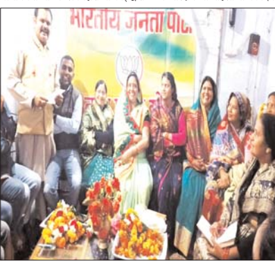
जा रहा था जिसका लोकसभा और राज्यसभा में बिल पास नहीं होने दिया यह महिला विरोधी नीतियों के साथ हमेशा काम करते रहे। उन्होंने कहा कि हम सब