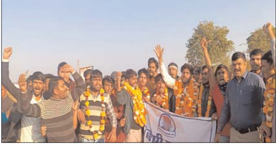
जेल के बाहर धरने पर बैठ गए और नरेंबाजी करने पदाधिकारी जेल के सामने ही जेलर मुर्दाबाद के नारे लगाते रहे और प्रशासन को कोसते रहे इसके बाद जब ओबीसी महासभा के सभी कार्यकर्ताओं को जेल से बाहर निकाला गया तो उन्होंने ओबीसी महासभा जिदाबाद के नारे लगाते हुए उनका जोरदार स्वागत किया और मालाएं पहनाई इसके बाद ओबीसी महासभा के समस्त कार्यकर्ता शहर से जुलूस निकालते हुए गए जिसके दौरान ओबीसी महासभा के कार्यकर्ताओं का जेल से रिहा होने पर जगह-जगह स्वागत किया गया इसके बाद वह प्राण छत्रावास पहुंचकर अपनी मीटिंग ली और मीटिंग के बाद अपने अपने घर चले गए

शिवपुरी- 16 दिसंबर को मुख्यमंत्री कार्यक्रम में काले झंडे दिखाने वाले ओबीसी के कार्यकर्ता जिनको कोतवाली पुलिस ने 151 की कार्रवाई कर जेल भेज दिया गया था लगातार दो दिन से चल रहे उनकी रिहाई पर ओबीसी महासभा धरना दे रही थी आज भी ओबीसी महासभा के द्वारा जब उनकी जमानत करवाई गई तो जेल में से उनको बाहर निकलने से पहले जब वह भी सीमा सभा को पता चला कि जेल में उनके साथ में अभद्रता की गई है तो ओबीसी महासभा के कार्यकर्ता