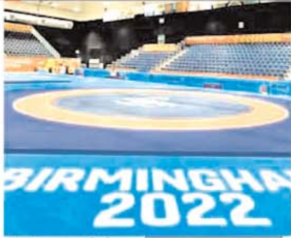
बर्मिंघम 2022 स्टेडियम का रेसलिंग वेन्यू खाली कराया गया है।