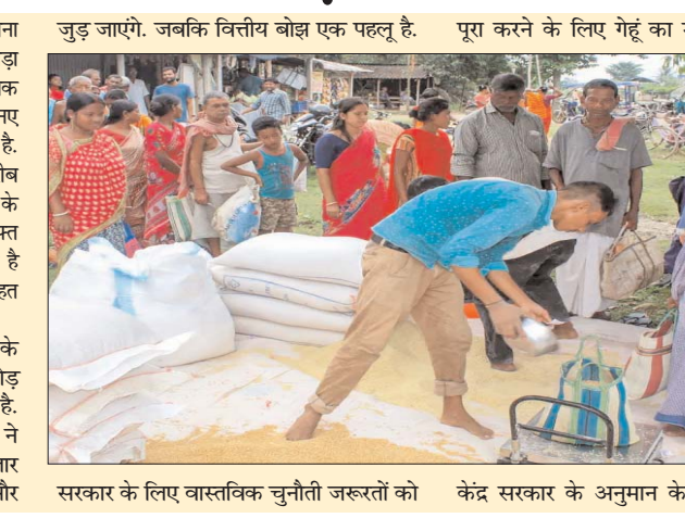
सरकार के लिए वास्तविक चुनौती जरूरतों को केंद्र सरकार के अनुमान के मुताबिक 138

नई दिल्ली। प्रधानमंत्री गरीब कल्याण अन्न योजना को आगे बढ़ाने को लेकर सरकार जल्द ही बड़ा फैसला ले सकती है. मीडिया रिपोर्ट के मुताबिक सरकार पीएम गरीब कल्याण अन्न योजना को नए साल में जारी रखने के विचार के खिलाफ नहीं है. माना जा रहा है कि इस योजना से समाज के गरीब और कमजोर वर्गों को फायदा हुआ है. योजना के तहत लाभार्थियों को हर महीने 5 किलो मुफ्त खाद्यान्न मिलता है. यह उस मात्रा के अतिरिक्त है जो उन्हें राष्ट्रीय खाद्य सुरक्षा अधिनियम के तहत बेहद ही रियायती दाम पर दिया जाता है. केंद्र ने पीएम गरीब कल्याण अन्न योजना के सात चरणों के लिए कुल 3.9 लाख करोड़ रुपये की सब्सिडी का अनुमान लगाया है. टीओआई की एक रिपोर्ट के मुताबिक सूत्रों ने कहा है कि मार्च 2023 तक योजना के विस्तार से सब्सिडी बिल में 40,000 करोड़ रुपये और