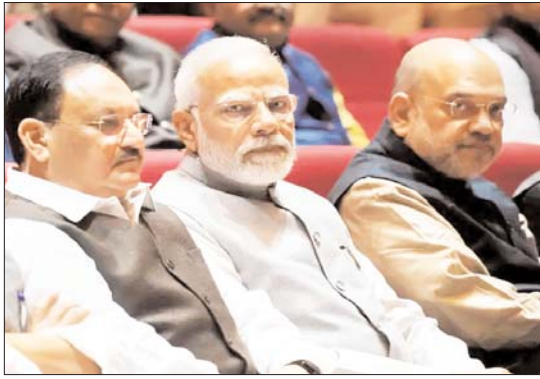
है कि बीजेपी के संसदीय बोर्ड के पास पार्टी

बीजेपी की राष्ट्रीय कार्यकारिणी की बैठक जनवरी (2023) के मध्य में हो सकती है. कर्नाटक या मध्य प्रदेश में यह बैठक रखी जा सकती है. हालांकि, जगह और तारीख को लेकर अंतिम फैसला आने वाले हफ्तों में लिया जाएगा. इकोनॉमिक टाइम्स ने जानकारी लोगों के हवाले से यह रिपोर्ट प्रकाशित की है. रिपोर्ट में कहा गया है कि सबकी निगाहें बीजेपी की जनवरी में होने वाली राष्ट्रीय कार्यकारिणी की बैठक पर हैं. रिपोर्ट के मुताबिक, बीजेपी आमतौर पर ऐसे राज्य में राष्ट्रीय कार्यकारिणी की बैठक करती है, जहां चुनाव होने वाले होते हैं. चूंकि कर्नाटक में 2023 की शुरुआत में विधानसभा चुनाव होना है, इसलिए यह दक्षिणी राज्य बैठक के लिए पसंद में गिना जा रहा है. बीजेपी की राष्ट्रीय कार्यकारिणी की बैठक ऐसे समय होगी जब पार्टी के राष्ट्रीय अध्यक्ष जेपी नड्डा का कार्यकाल 20 जनवरी को खत्म हो रहा है. रिपोर्ट में पार्टी सूत्रों के हवाले से लिखा गया