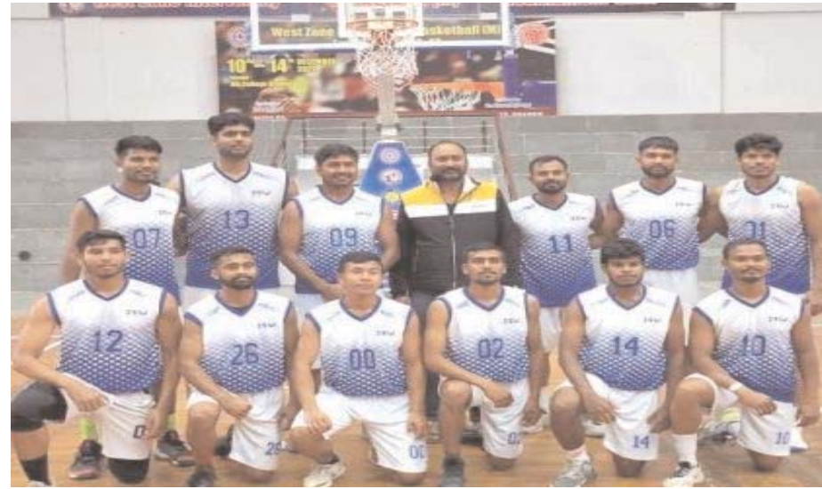
लगभग सारे मैच जीतते हुए आल इंडिया है। आईटीएम यूनिवर्सिटी के स्पोर्ट्स यूनिवर्सिटी ग्वालियर की टीम ने ही

ग्वालियर। अपने शानदार खेल प्रदर्शन से आईटीएम यूनिवर्सिटी ग्वालियर ने इंटर यूनिवर्सिटी बास्केटबॉल चैम्पियनशिप के लिए दावेदारी दर्ज की है कि मध्यप्रदेश से सिर्फ आईटीएम