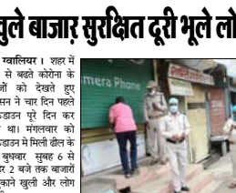
ज्वालियर । शहर में तेजी से बढ़ते कोरोना के मरीजों को देखते हुए प्रशासन ने चार दिन पहले लॉकडाउन पूर्व दिनांक को लॉकडाउन में मिसली डील के बाद बुधवार सुबह 6 से दोपहर 2 बजे तक बाजारों में दुकानें खुली और लोग अनजाने अनजान का सामना लेते बाजार में निकल पड़े लॉकडाउन में डील मिसली हो लोगों ने निगमों का उल्लंघन किया। इसकी मिस्री और बाजारों में कई लोग बिना मास्क लगाए लकड़वा कर दिवा था। लेकिन मरीजों को भूलते नगर आए।