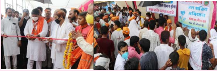
माध्यम से निरंतर एवं पर्याप्त मात्रा में उचित गुणवत्ता का स्वच्छ जल प्रदान करना है। इस मिशन के अन्तर्गत प्रत्येक व्यक्ति को 55एलपीपीडी जल प्रदाय करने का प्रावधान है। उन्होंने कहा कि मुख्यमंत्री नलजल योजना खेड़ा मेवदा के अन्तर्गत समस्त बसाहटों में धेरू नल कनेक्शन के माध्यम से जल प्रदाय किया जाना है। जिसमें खेड़ा मेवदा में 2 करोड़ 59 लाख 3 हजार रुपये की लागत से 4 ट्यूबवेल, 1683 मीटर रवर्जिमेंट, 9 हजार 132 मीटर वितरण नलकायें (पाइप लाइन), 5 ना मीटर पम्प समस्तसेबल एवं 2 सेनेट्री फ्यूएल (मीटर पंप) लगाये जायेंगे और 1 नगर ट्रान्सफॉर्मर लगाया जायेगा। जिसके माध्यम से 1508 धेरू नल कनेक्शन दिये जायेंगे। इसमें 8 हजार 603 जनसंख्या लाभान्वित होगी। इसी प्रकार ग्राम नावली में 1 करोड़ 55 लाख 7 हजार रुपये की लागत से 3 ना ट्यूबवेल, 82 मीटर रवर्जिमेंट, 11 हजार 693 मीटर वितरण नलकायें (पाइप लाइन), 3 ना समस्तसेबल (मीटर पंप), 1 सेनेट्री फ्यूएल और 1 ट्रान्सफॉर्मर लगाया जायेगा। जिसके माध्यम से 593 धेरू नल कनेक्शन दिये जायेंगे। इसमें 3 हजार 493 लोग लाभान्वित होंगे। कार्यक्रम के अन्त में पार्टी पदाधिकारियों ने राज्यमंत्री का आभार व्यक्त किया।

मुरैना। प्रदेश के राज्यमंत्री श्री गिराज डण्डोतिया ने कहा कि मुरैना विकासखण्ड के ग्राम खेड़ामेवदा और अम्बाड विकासखण्ड के ग्राम नावली में बहुमतिरित नलजल योजनाओं की मांग आज पूरी होने जा रही है। प्रदेश सरकार द्वारा मुना विकासखण्ड के ग्राम खेड़ा मेवदा और अम्बाड विकासखण्ड के ग्राम नावली में 4 करोड़ 14 लाख 1 हजार रुपये की लागत से नलजल योजना का निर्माण किया जाएगा। जिसमें धेरू नलकेशन 2 हजार 101 और 7 ट्यूबवेल लगाये जायेंगे। जिससे पानी की सफाई खाद्य द्राव को जायेगी। यह बात उन्होंने बुधवार को विधानसभा क्षेत्र दिम्नी के ग्राम खेड़ा मेवदा, नावली में नलजल योजनाओं का भूमिपूजन करते समय कहा। इस अवसर पर पीएचई के कार्यलयन वंशी श्री आरंभ करीया, संबोधित एसडीएम और बड़ी संख्या में पार्टी कर्ता उपस्थित थे। राज्यमंत्री श्री डण्डोतिया ने बताया कि जल जीवन मिशन का लक्ष्य 2024 तक ग्राम के प्रत्येक परिवार को परेशु नल कनेक्शन के