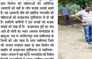
कृषि विश्वविद्यालय एवं पशुपालन विभाग के जेएचए कड़कनाथ के 40-40 युवा महिलाएं कर रही कड़कनाथ मुर्गी पालन का काम कर रही हैं। कड़कनाथ में इस महीने की 58 सहायता महिलाओं को स्वयंसेविका

ज्वालियर । स्व-सहायता समूहों से जुड़ी ग्राम सिरोल की महिलाओं की आर्थिक आसदी को जहाँ के लोग कड़कनाथ कमाई करती हैं। यह आसदी गाँव की सहयोगिता जनाजाति की महिलाओं को कड़कनाथ मुर्गीपालन से हो रही है। इससे ग्रामीणों ने इस कमाई को कड़कनाथ के ज्ञानुआ, धार य अलीतानुत तथा खलीसगढ़ के जिले की ओर जाता है। मगर ज्वालियर जिले की जनदर पंचायत उमरा के ग्राम सिरोल की खड़ाति भी कड़कनाथ मुर्गीपालन से ज्वालियर चंचल अंचल में बढ़ गई है। मध्यदेश की विविध पिछड़ी जनजातियों में सुमार सहयोगिता जनाजाति से लखर रहने वाली ग्राम सिरोल की महिलायें राष्ट्रीय ग्रामीण आजीविका मिशन के तहत बने स्व-सहायता समूहों से जुड़कर कड़कनाथ मुर्गी पालन का काम कर रही हैं। कड़कनाथ में इस महीने की 58 सहायता महिलाओं को स्वयंसेविका