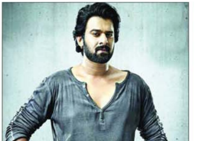
2024 के वीकेंड के दौरान लाने का है। यह छुट्टियों से भरा सप्ताह है। इसमें ईद, अम्बेडकर जयंती, तमिल नव वर्ष और राम नवमी सात दिनों के अंतराल में

साउथ सुपरस्टार प्रभास और अभिनेत्री दीपिका पादुकोण फिल्म प्रोजेक्ट के पर काम कर रहे हैं। साउथ निर्देशक नाग अश्विन इस फिल्म का निर्देशन कर रहे हैं। इसी बीच एक रिपोर्ट में दावा किया गया है कि मेकर्स इस फिल्म को 2024 में ईद के मौके पर रिलीज करेंगे, जिसके चलते इसकी टकरा सलमान खान की फिल्म से होगी। सलमान अभिनीत अली अब्बास जफर की फिल्म भी 2024 में ईद को सिनेमाघरों में आ सकती है।