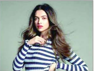
के लिए मौखिक तौर पर हमी भर दी है। मेकर्स अगले साल जून में इस फिल्म की शूटिंग शुरू करने की योजना बना रहे हैं। फिल्म को ईद के मौके पर 2024

मनाई जाएगी। ■ खबरों की मानें तो फिल्म की शूटिंग इस साल के अंत या अगले साल की शुरुआत तक खत्म हो जाएगी। इसके बाद पोस्ट-प्रोडक्शन काम शुरू किया जाएगा। यह वीएफएक्स से भरी फिल्म है, इसलिए इसके पोस्ट-प्रोडक्शन में लगभग एक साल का समय लग सकता है। टीम ने फिल्म में तीसरे विश्व युद्ध का एक काल्पनिक प्लॉट भी शामिल किया है। यही वजह है कि इस प्रोजेक्ट में मेकर्स को अधिक समय लगेगा। ■ अली अब्बास जफर की फिल्म को लेकर सलमान पिछले कुछ समय से चर्चा बटोर रहे हैं। इससे पहले दोनों ने 2017 में आई एक्शन थ्रिलर फिल्म टाइगर जिंदा है के लिए हाथ मिलाया था। सलमान ने फिल्म