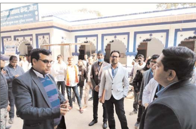
कलेक्टर ने सुमावली, छैरा और जौरा की स्वास्थ्य सुविधाओं का किया औचक निरीक्षण

अस्थाना बुधवार को सामुदायिक स्वास्थ्य केन्द्र जौरा के परिसर में चल रहे एनआरसी केन्द्र का निरीक्षण किया। निरीक्षण के दौरान 10 बच्चे भर्ती मिले। कलेक्टर ने भर्ती बच्चों की माताओं से खान-पान के बारे में विस्तार से चर्चा की और कहा कि पूरे समय रहकर बच्चों को स्वस्थ करके ले जायें।