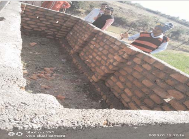
बारिश के पहले गोल्डर भी इधर-उधर के उद्देश्य पूरे हो पा रहे हैं ऐसे अनेकों प्रश्न

करके डैम की प्रतिपूर्ति कर दी गई है, वहीं बिखरे पड़े हैं क्या ऐसे हालातों में सरकार