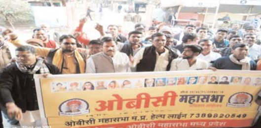
सांसद एवं मुख्यमंत्री का घेराव करते हैं लेकर पूरे मध्यप्रदेश के पिछड़ वर्ग समाज

मुख्यमंत्री का पद एक संवैधानिक पद है हम भी विभिन्न मुद्दों को लेकर विधायक लेकिन इस प्रकार के शब्दों का प्रयोग करना किसी भी परिस्थिति में ठीक नहीं है इसको