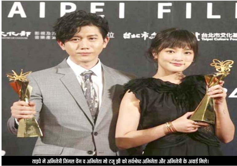
ताइपे में अभिनेत्री गिगल वेग व अभिनेता मो टूजू झी को सर्वश्रेष्ठ अभिनेता और अभिनेत्री के अवार्ड मिले।