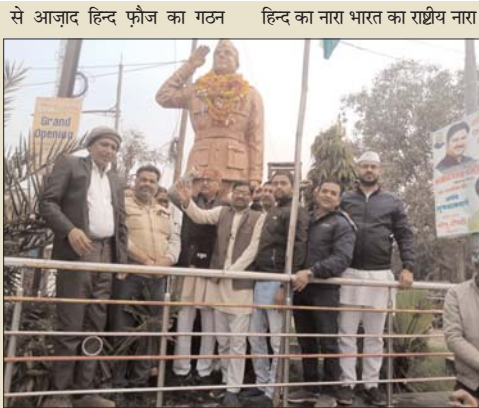
से आजाद हिन्द फौज का गठन हिन्द का नारा भारत का राष्ट्रीय नारा तुम्हें आजादी दूंगा- का नारा भी उन्का था जो उस समय अत्यधिक प्रचलन में आया