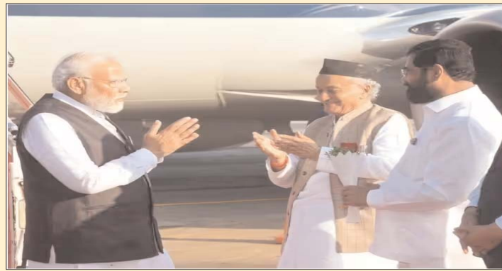
कोश्यारी कई बयानों को लेकर चर्चा में रहे हैं। उन पर विपक्ष ने पक्षपाती होने का भी आरोप लगाया

राज्य सरकार के कई नेताओं ने उनकी आलोचना की थी। दरअसल, राज्यपाल कोश्यारी ने बीते साल नवंबर में कहा था कि छत्रपति शिवाजी महाराज "पुराने दिनों" के आइकॉन थे। राज्य में आइकॉन के बारे में बात करते हुए उन्होंने बाबासाहेब अंबेडकर और केंद्रीय मंत्री नितिन गडकरी का जिक्र किया था। उन्होंने कहा था कि, पहले जब आपसे पूछा जाता था कि आपका आइकॉन कौन है तो जवाहरलाल नेहरू, सुभाष चंद्र बोस और महात्मा गांधी का जवाब होता था। महाराष्ट्र में आपको कहीं और देखने की जरूरत नहीं है क्योंकि यहां बहुत सारे आइकॉन हैं। जहां छत्रपति शिवाजी महाराज पुराने जमाने के हैं, वहीं अंबेडकर और नितिन गडकरी हैं। इससे पहले भी कोश्यारी के एक बयान को लेकर हंगामा हुआ था। जुलाई 2022 में उन्होंने कहा था कि अगर महाराष्ट्र से गुजराती और राजस्थानी हट जायें तो मुंबई देश की आर्थिक राजधानी होने का अपना स्टेटस खो देगी। उनकी इस टिप्पणी पर सभी पार्टियों ने कड़ी प्रतिक्रिया दी थी। बाद में उन्होंने एक माफीनामा जारी करते हुए कहा था कि मुंबई के विकास में कुछ समुदायों के योगदान की सराहना करते हुए शायद मैंने गलती की।