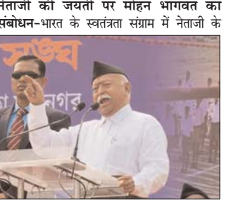
नेताजी की जयंती पर मोहन भागवत का संबोधन-भारत के स्वतंत्रता संग्राम में नेताजी के योगदान की सराहना करते हुए मोहन भागवत ने सभी से सुभाष चंद्र बोस के गुणों व शिक्षाओं को आत्मसात करने और देश को "विश्व गुरु" बनाने की दिशा में काम करने का आग्रह किया। उन्होंने कोलकाता में कहा,

महान क्रांतिकारी सुभाष चंद्र बोस की 126वीं जयंती के मौके पर जस्र के चीफ मोहन भागवत ने कहा कि नेताजी और हमारे रास्ते अलग-अलग हो सकते हैं, लेकिन दोनों के लक्ष्य एक हैं। हमें भारत को विश्व गुरु बनाना है। राष्ट्रीय स्वयंसेवक संघ के चीफ मोहन भागवत ने कहा कि उनके राष्ट्र-विंग ऑर्गनाइजेशन और नेताजी सुभाष चंद्र बोस का लक्ष्य एक ही है- भारत को एक महान राष्ट्र बनाना। आरएसएस और स्वतंत्रता सेनानी की विचारधारा समान नहीं होने को लेकर जारी बहस के बीच मोहन भागवत ने नेताजी की 126वीं जयंती के मौके पर सोमवार (23 जनवरी) को यह बयान दिया। वहीं, आरएसएस के आलोचक यह कहते रहे हैं कि नेताजी सुभाष चंद्र बोस धर्मनिरपेक्षता में विश्वास करते थे, जो कि "आरएसएस की हिंदुत्ववादी विचारधारा के विपरीत है।"