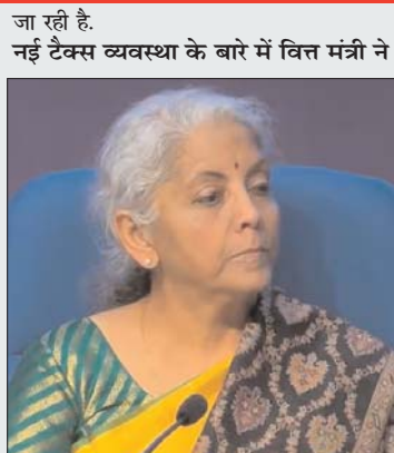
क्या कहा-वित्त मंत्री ने कहा कि ये एक ऐसा बजट है जो पूरी तरह संतुलित है। हम बिना

नई दिल्ली। वित्त मंत्री निर्मला सीतारामन ने आज बजट पेश करने के बाद अपनी पहली प्रेस कॉन्फ्रेंस में कहा कि इस बजट में उन्होंने संसाधनों और खर्चों के बीच संतुलन बिटाने की कोशिश की है। कैपिटल एक्सपेंडिचर से लेकर आम जनता खासकर मिडिल क्लास के लिए टैक्स के नियमों में छूट दी है। देश डायरेक्ट टैक्स के नियमों के आसान होने का इंतजार कर रहा था और सरकार ने इस बजट के जरिए ऐसा कर दिखाया है। वित्त मंत्री निर्मला सीतारामन ने क्या कहा-वित्त मंत्री ने कहा कि पब्लिक सेक्टर इन्वेस्टमेंट को हमारी सरकार संतुलित करने की कोशिश कर रही है और इसके साथ ही टैक्स के नियमों को आसान बनाने के लिए भी प्रयास लगातार जारी हैं। इसके साथ ही साथ एमएसएमई सेक्टर को बढ़ा कर्ज देने के जरिए उनकी आर्थिक स्थिति सुधारने की कोशिश की