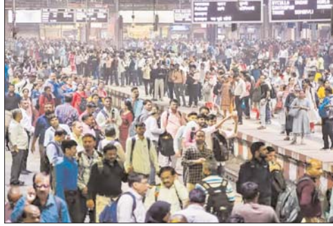
साल से ज्यादा उम्र के लोगों को 40 फीसदी और 58 साल की महिलाओं को 50 फीसदी छूट खत्म करने के बाद करोड़ों की कमाई की थी। निर्मला सीतारामन ने अपने बजट

को रेलवे किराये में छूट दी जाती थी। साल 2019 में कोरोना महामारी के चलते इसे बंद कर दिया गया। पहले 60 तक छूट का प्रावधान था। इसके बाद से ही लगातार उम्मीद लगाई जा रही थी कि सरकार बुजुर्गों को राहत देगी। रेलवे ने