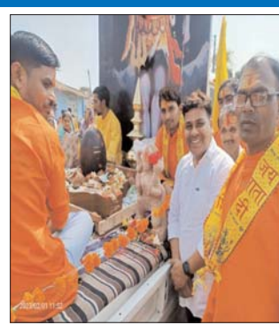
महाआरती एवं महाप्रसादी पश्चात् शिव महिमा