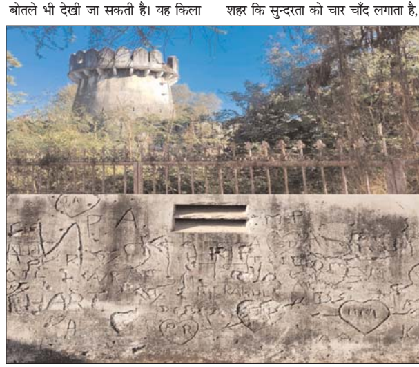
शहर के प्रमुख चौराहा पर होने के कारण लेकिन यहाँ के जनप्रतिनिधियों ने किले के

रीतेश अवस्थी पुष्पांजली टुडे दमोह। रानी दमयंती कि नगरी दमोह में पुरातत्व अवशेष का भंडार है, यहाँ ऐसे अनेक स्थान हैं जहाँ यह अवशेष बिखरे पड़े हैं लेकिन उन्हें संरक्षित करने के प्रयास नहीं किये जा रहे यहाँ जिले का एक मात्र पुरातत्व संग्रहालय जिन प्रेमी प्रेमिकाओं को एक दूसरे को प्यार का सन्देश देने का माध्यम बना हुआ है यहाँ के मनचलों के द्वारा इन धरोहरों को प्यार के नाम पर बर्बाद करने का सिलसिला लगातार जारी है और यह युवा कैलेंडर डे पर अपने प्यार का इजहार प्रेमी का नाम दीवाल पर लिखकर उन्हें प्रपोज करते देखा जा सकता है, जबकि किले के ठीक सामने थाना कोतवाली, गर्ल्स छात्रावास, स्कूल और भाजपा कार्यालय भी है, तब भी यह मनचले बेखौफ होकर इन दीवारों पर अपने प्रेमी का नाम लिखने से नहीं डरते हैं तो वही रात्रि के समय यहाँ पर शराबियों अड्ड बन जाता है किले के बाजू से बने तहसील ग्राउंड पर शराब कि टूटी