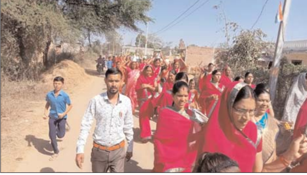
की स्मृति स्वरूप ग्रामों में वृक्षारोपण जैसी पर्यावरण संरक्षण के प्रति लोगों को जागरूक

द्वारा दिया जा रहा है। यात्रा के दौरान इस यात्रा गतिविधियां परिषद के माध्यम से की जाकर