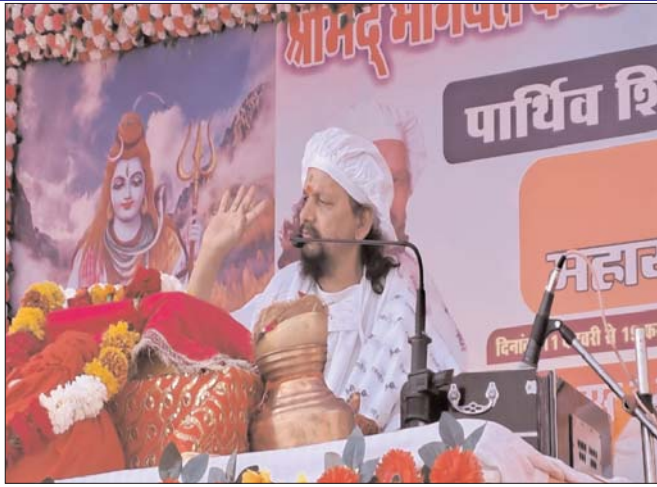
पडा। संत श्री ने महाभारत रामायण से जुड़े विभिन्न प्रसंग सुनाए। साथ ही