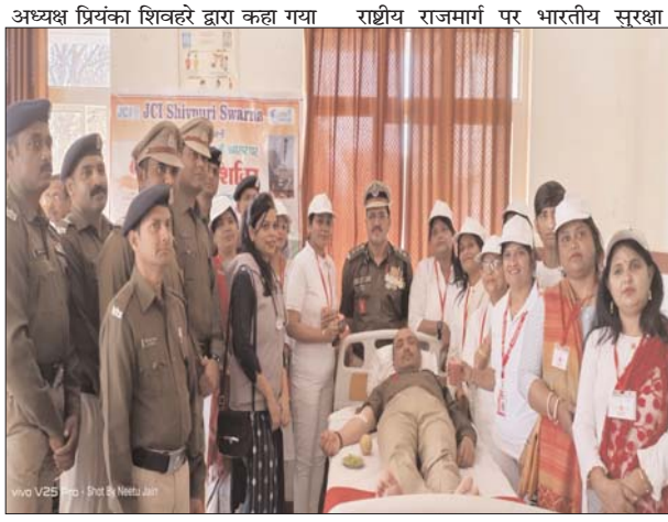
14 फरवरी 2019 को, जम्मू श्रीनगर कर्मियों को ले जाने वाले सीआरपीएफ