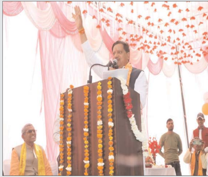
जीवन मिशन योजना अंतर्गत हर घर टॉटी वाले नल से पानी पहुंचेगा। सहकारिता मंत्री डॉ अरविन्द सिंह भदौरिया ने कहा कि महिलाओं की सुविधा हेतु प्रदेश के मुख्यमंत्री श्री शिवराज सिंह चौहान ने विभिन्न प्रकार की योजनाएं प्रारंभ की हैं। यह अपने आप में एक अनोखा उदाहरण है। उन्होंने योजनाओं के बारे में बताते हुए कहा कि उज्ज्वला योजना, लाड़ली लक्ष्मी योजना और अब लाड़ली बहना योजना शुरू