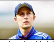
साथ ही युवा बल्लेबाज जो डेनली को बाहर होना पड़ा है। डेनली का प्रदर्शन पहले टेस्ट में अच्छा नहीं रहा था और

मैनचेस्टर। इंग्लैंड क्रिकेट टीम के नियमित कप्तान जो रुट वेस्टइंडीज के खिलाफ गुरुवार से शुरू हो रहे दूसरे टेस्ट में खेलेंगे। रुट अपने दूसरे बच्चे के जन्म के लिए अपनी पत्नी के साथ रहने के कारण साउथम्पटन में पहले टेस्ट में नहीं खेले थे। ऑलराउंडर बेन स्टोक्स की कप्तानी में खेले गये इस मैच में इंग्लैंड टीम को चार विकेट से हार का सामना करना पड़ा था। रुट की वापसी के