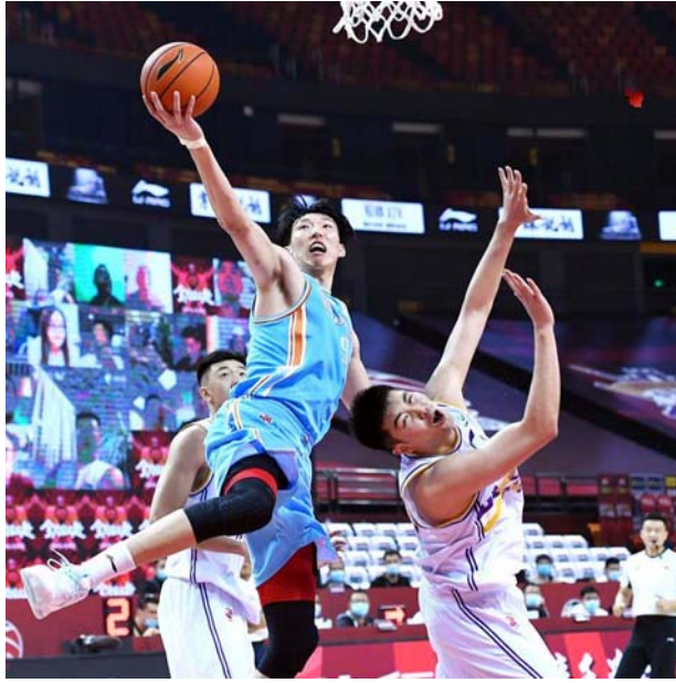
क्रोमडभो में चीनी बास्केटबाल संघ के मैच में खेलते हुए खिलाड़ी।

नई दिल्ली। फरॉटा धातुका दुती चंद ने कहा है कि वह अपनी लगजरी कार (बीएमडब्ल्यू) इसलिए बेच रही है क्योंकि इसके रखरखाव पर बहुत खर्च हो रहा है। दुती ने इन कारों को अपहारहीन बताया है जिसमें कहा गया है कि अपनी अपनी ट्रेनिंग के लिए पैसा खुदने के लिए उसे कार बेचनी पड़ रही है। इसी के साथ ही दुती का कार बेचने को लेकर लगजरी वा रही अटकों को समाप्त करने का प्रयास किया है। कुछ दिन पहले आ दुती ने सोशल मीडिया पर पोस्ट डाली थी कि वह रखरखाव के अधिक खर्च के कारण अपनी बीएमडब्ल्यू कार बेचना चाहती है। इस पोस्ट को बाद में डिलीट कर दिया गया पर खेल समुदाय ने इस पर तीखी प्रतिक्रिया दी। पूर्व ऑलरकार खिलाड़ी योगेश्वर देववन ने दुती का समर्थन किया जबकि अन्य खिलाड़ियों ने कहा कि उन्हें केंद्रीय खेल मंत्रालय, ऑलरकार सरकार और भारतीय ऐथलेटिक्स महासंघ (एएफआई) से