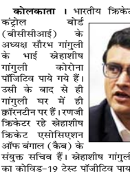
कोलकाता। भारतीय क्रिकेट बोर्ड (बीसीसीआई) के अध्यक्ष सौरभ गांगुली के भाई स्नेहाशीष को कोरोना पॉजिटिव पाये गये हैं। उसी के बाद से ही गांगुली घर में ही क्वारंटीन पर हैं। रणजी क्रिकेटर रहे स्नेहाशीष क्रिकेट एसोसिएशन ऑफ बंगाल (केब) के संयुक्त सचिव हैं। स्नेहाशीष गांगुली समय तक होम क्वारंटीन में रहना का कोविड-19 टेस्ट पॉजिटिव पाया होगा।

स्नेहाशीष को इसी के बाद अस्पताल में भर्ती करवाया गया है। केब के एक अधिकारी ने कहा, 96घण्टे कुछ दिनों से उन्हें बुखार था और आज उनका कोरोना टेस्ट पॉजिटिव आया है। उन्हें अस्पताल में भर्ती करवाया गया है। इसके बाद से ही स्वास्थ्य प्रोटोकॉल को देखते हुए गांगुली को एक तय समय तक होम क्वारंटीन में रहना