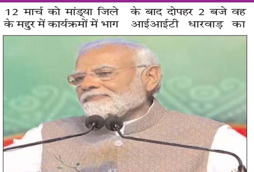
लेने के लिए कर्नाटक उद्घाटन करने के लिए जाएंगे. कार्यक्रम समाप्त होने हुबली पहुंचेंगे. इसके बाद

कर्नाटक में इसी साल विधानसभा चुनाव होने वाले हैं. प्रदेश में इस वक्त बीजेपी की सरकार है और पार्टी वापसी के लिए पूरी ताकत झोंक रही है. प्रदेश में एक बार फिर से कमल खिलाने के लिए पार्टी ने पीएम मोदी को मैदान में उतार दिया है. इसी के तहत वह लगातार कर्नाटक का दौरा कर रहे हैं. पीएम मोदी 12 मार्च को कर्नाटक दौरे पर जाएंगे. प्रधानमंत्री मोदी इस बार मांड्या के दौरे पर रहेंगे. यहां वह कई विकास परियोजनाओं का शिलान्यास और उद्घाटन करेंगे. इसके बाद वह हुबली जाएंगे. वहां भी कई परियोजनाओं का लोकार्पण और शिलान्यास करेंगे. इससे पहले प्रधानमंत्री 27 फरवरी को कर्नाटक दौरे पर गए थे. इस दौरे पर पीएम मोदी ने शिवमोगा एयरपोर्ट का उद्घाटन किया था. पीएम मोदी के प्रस्तावित कर्नाटक दौरे की जानकारी केंद्रीय संसदीय कार्य मंत्री प्रह्लाद जोशी ने दी है. केंद्रीय मंत्री के अनुसार, प्रधानमंत्री मोदी 12 मार्च को मांड्या जिले के बाद दोपहर 2 बजे वह के महुदूर में कार्यक्रमों में भाग आईआईटी धारवाड़ का